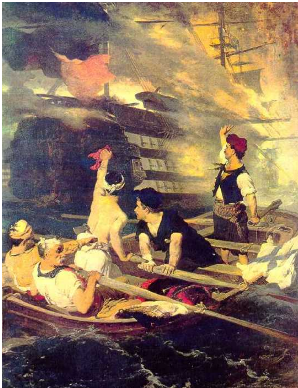
Κανάρης. Πίνακας του Νικηφόρου Λύτρα.

Έτσι με τον ήλιο κατάστηθα στο πέλαγο πού ασβεστώνει την αντικρυνή πλαγιά της μέρας