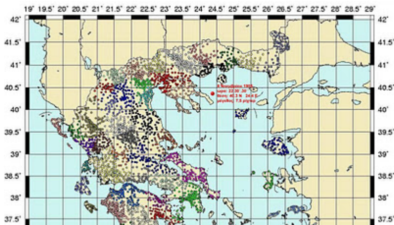
1905, November 8, 22:30:30, 40.3°N, 24.4°E, h=n, M=7.5, Chalkidiki (X, Athos).

Στις 10.30΄ το βράδι της 8 ης Νοεμβρίου 1905, με επίκεντρο τη θαλάσσια περιοχή 7 μίλια ανατολικά της Ιεράς Μονής Σταυρονικήτα, σημειώθηκε ο τρίτος σε μέγεθος σεισμός (7.5 ρίχτερ) στην ελληνική επικράτεια: