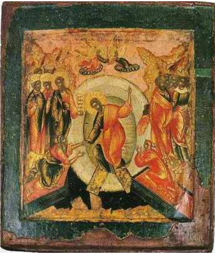
Η Κάθοδος στον Άδη. Εικόνα Ρώσικου εργαστηρίου 17ου αιώνα.

Ρωτάτε, γιατί μνημονεύουμε τους «κεκοιμημένους». Γιατί έτσι διδαχθήκαμε από την άγια Εκκλησία μας. Γιατί έτσι παραλάβαμε από τους θεοφώτιστους και πνευματοφόρους πατέρες μας. Γιατί έτσι γινόταν και γίνεται σ' όλους τους χριστιανικούς αιώνες, από την αποστολική εποχή μέχρι σήμερα. Αλλά το φιλοπερίεργο μυαλουδάκι μας θέλει να χώνεται παντού και να φωνάζει: Γιατί; Γιατί; Γιατί;... Ξέρετε τι του χρειάζεται; Να του δώσετε, με την ακράδαντη πίστη σας, ένα γερό χαστούκι και να το αναγκάσετε έτσι να σωπάσει!