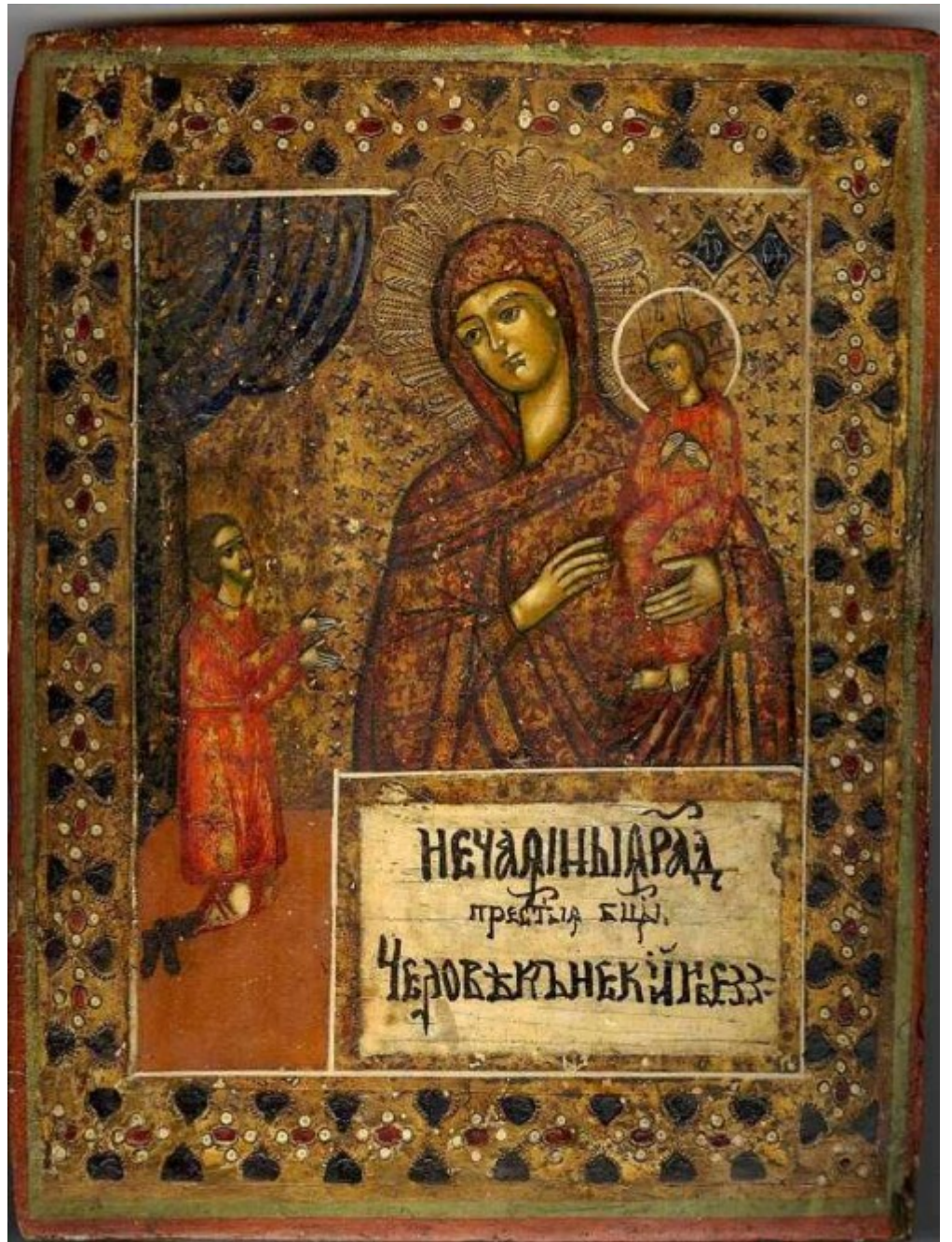
Πρωτοπρεσβυτέρου Δημητρίου Αθανασίου.