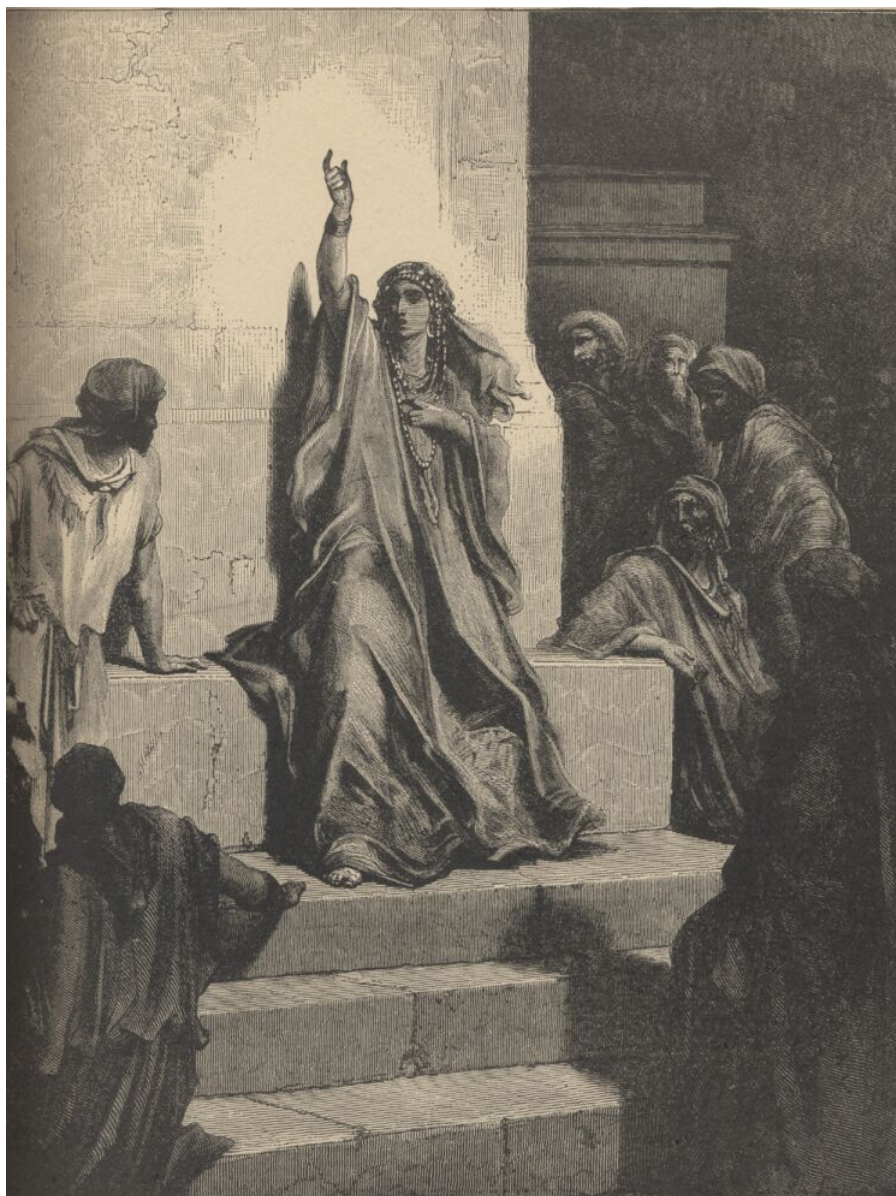
Η Δεββώρα, που ήταν προφήτισα και “κριτής” του Ισραήλ (βλ. Κριταί, κεφ. 4-5). Γκραβούρα του Gustave Doré (1832-1883).

Η χριστιανική πίστη κηρύσσει ακριβώς ότι ο προορισμός του ανθρώπου δεν είναι κάποια εγκόσμια «χρήση». Κάθε άνθρωπος καλείται να «θεωθεί», δηλαδή να γίνει κατά χάριν θεός, μέτοχος της άκτιστης δόξας του αληθινού Θεού, η οποία είναι η αιώνια ζωή. Ο ύψιστος αυτός θείος προορισμός, η αφάνταστη αυτή τιμή και δωρεά εκ μέρους του Κυρίου είναι για κάθε έναν άνθρωπο, είτε άνδρας είναι αυτός είτε γυναίκα. Για τον Θεό κάθε άνθρωπος είναι κάτι μοναδικό και ανεπανάληπτο, το οποίο αυτός ο ίδιος έφτιαξε για να ζει και να χαίρεται όλη την απεραντοσύνη Του.