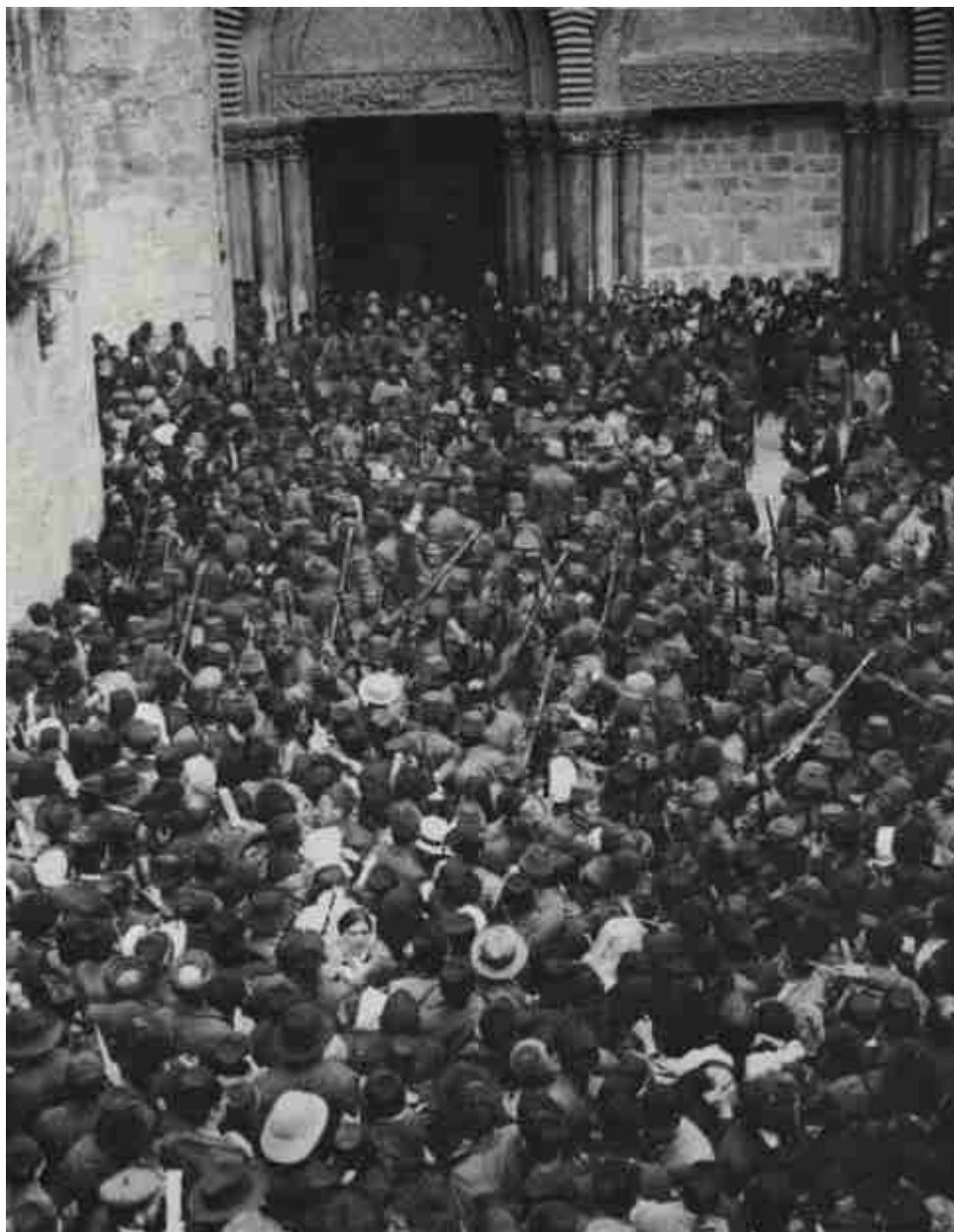
Η τελετή της Αφής του Αγίου Φωτός (1905)

Αποσπάσματα από ομιλία του Σεβασμιωτάτου Μητροπολίτου Νεαπολέως και Σαμάρειας (του Πατριαρχείου Ιεροσολύμων) κ.κ. Αμβροσίου, η οποία εκφωνήθηκε στο Συνοδικό της Ιεράς Μονής Όσιου Γρηγορίου Αγίου Όρους την 24η Οκτωβρίου 1986.