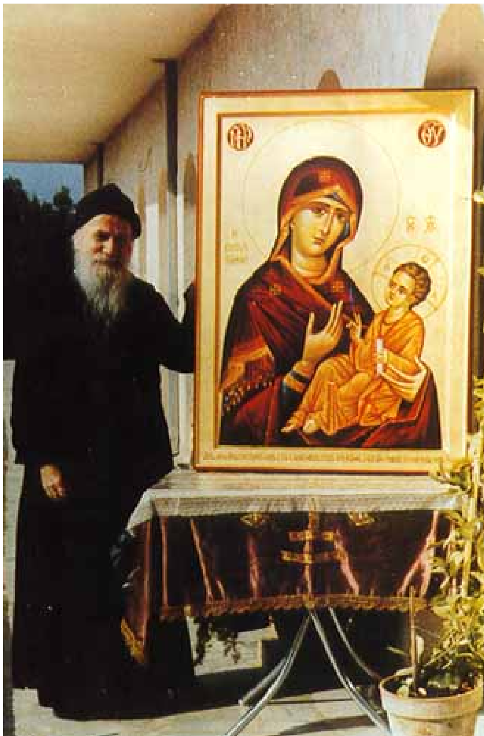
Ο Γέροντας Πορφύριος με μια εικόνα της Παναγίας.

Όποιος θέλει να γίνει χριστιανός, πρέπει πρώτα να γίνει ποιητής. Αυτό είναι! Πρέπει να πονάεις. Ν' αγαπάεις και να πονάεις. Να πονάεις γι' αυτόν που αγαπάεις. Η αγάπη κάνει κόπο για τον αγαπημένο. Όλη νύχτα τρέχει, αγρυπνεί, ματώνει τα πόδια, για να συναντηθεί με τον αγαπημένο. Κάνει θυσίες δεν λογαριάζει τίποτα, ούτε απειλές ούτε δυσκολίες εξαιτίας της αγάπης.