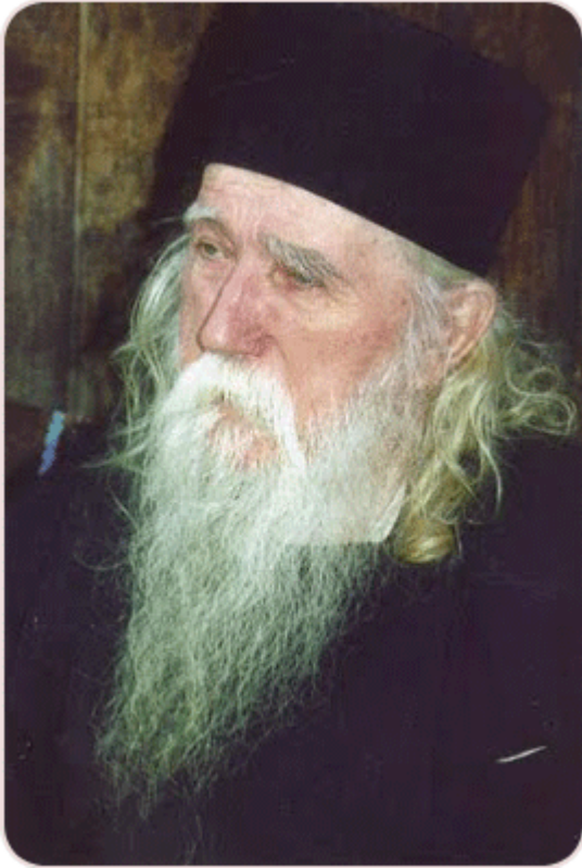
Γέροντας Κλεόπας Ηλιέ

Ο πρώτος καρπός της ευχής του Ιησού είναι η αποβολή των νοερών παραστάσεων από τις ματαιότητες του κόσμου, κατά τον άγιο Διάδοχο, ο οποίος λέγει: «Αυτά που είχαν μπει παλαιότερα στην καρδιά του ανθρώπου εξαφανίζονται μαζί με όλες τις ωραιότητες της ζωής»