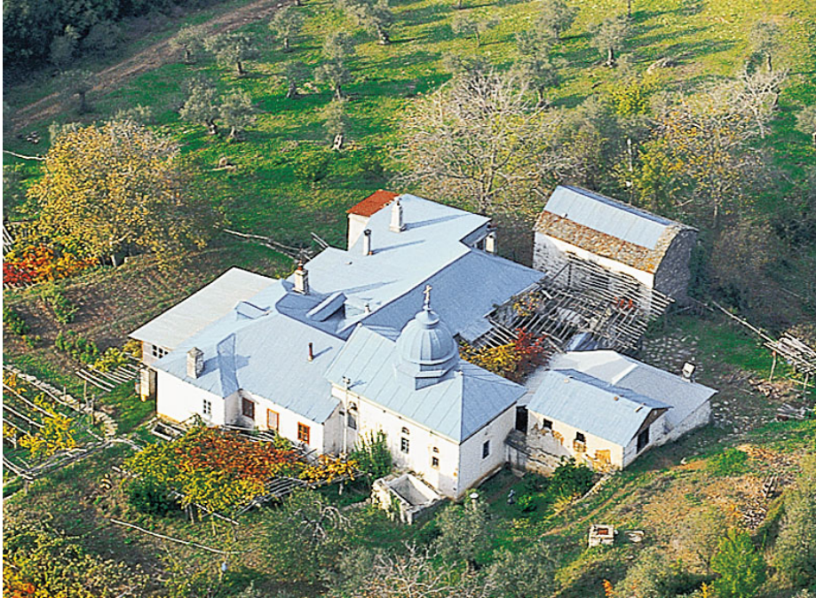
Το βατοπαιδινό κελλί του Αγίου Υπατίου, που βρίσκεται σε απόσταση 15 λεπτών διαδρομής από τη Μονή.

Ορθοδοξία και Ορθοπραξία / Συναξαριακές Μορφές