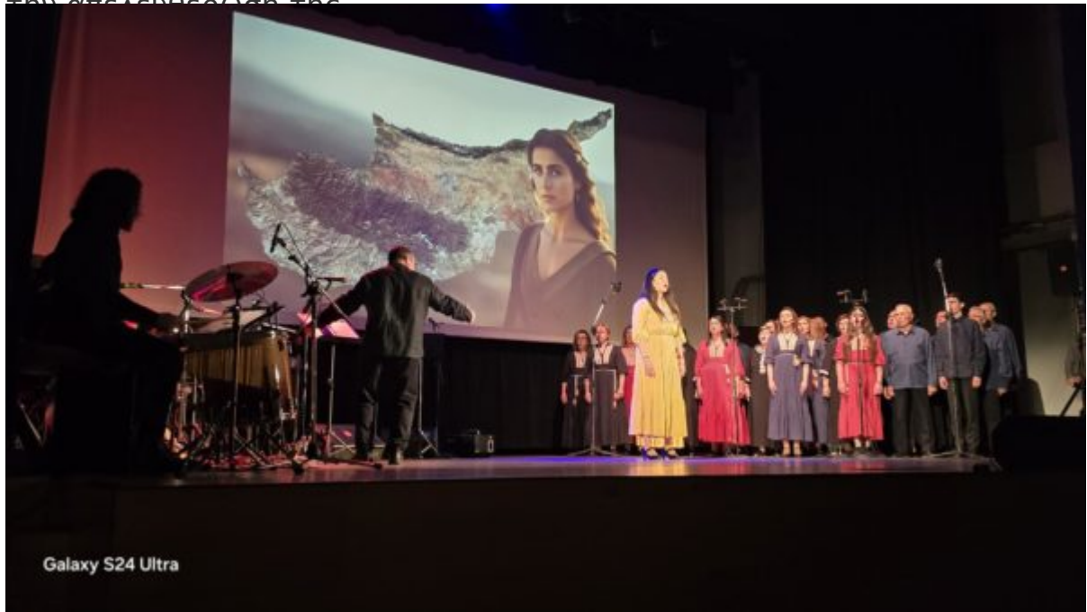
Galaxy S24 Ultra