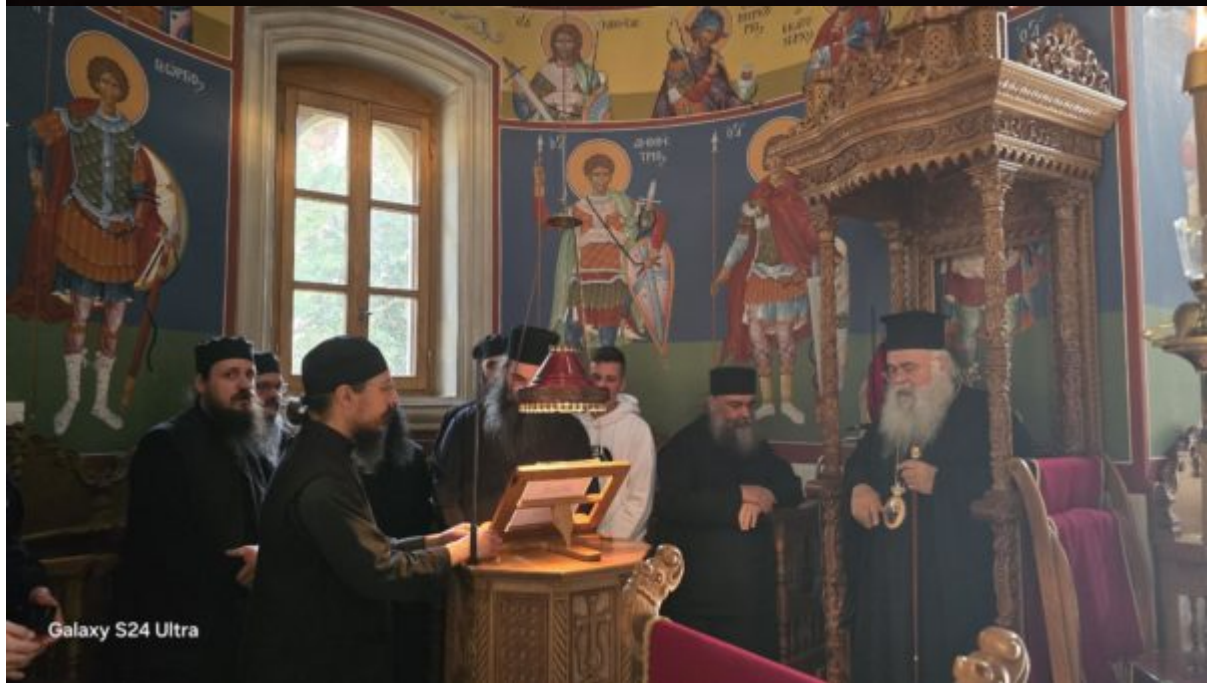
Galaxy S24 Ultra