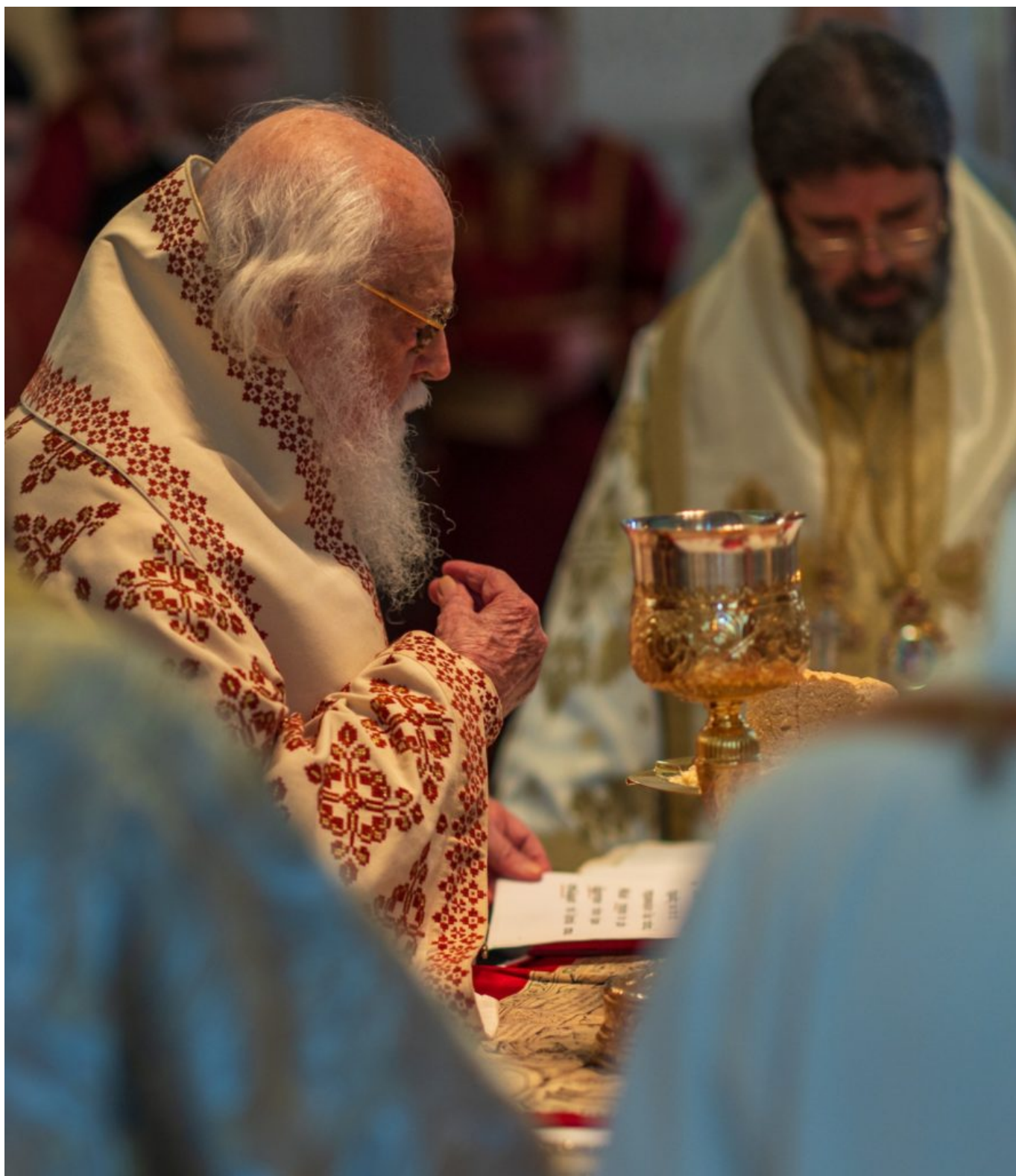
Φωτογραφία από το τελευταίο συλλείτουργο με τον Αρχιεπίσκοπο κυρό Αναστάσιο στις 15 Δεκεμβρίου 2024