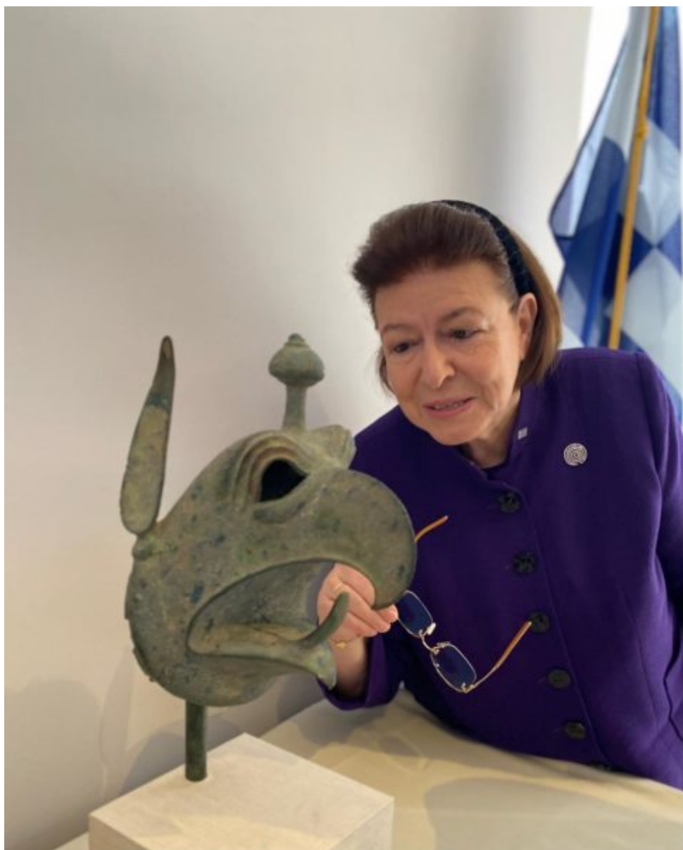
Η Υπουργός Πολιτισμού Λίνα Μενδώνη

Όπως σημείωσε η Υπουργός Πολιτισμού στον χαιρετισμό της στην τελετή, «ο συγκεκριμένος επαναπατρισμός είναι ιδιαίτερα σημαντικός, καθώς δεν είναι το αποτέλεσμα αιτήματος διεκδίκησης από τις ελληνικές αρχές. Αντίθετα, το ίδιο το MET, το 2018, ανέλαβε την πρωτοβουλία να διερευνήσει την προέλευση αυτής της κεφαλής γρύπα, η οποία ήταν μέρος της Συλλογής Ελληνικών και Ρωμαϊκών αρχαιοτήτων από τις αρχές της δεκαετίας του 1970, μετά από ιδιωτική δωρεά».