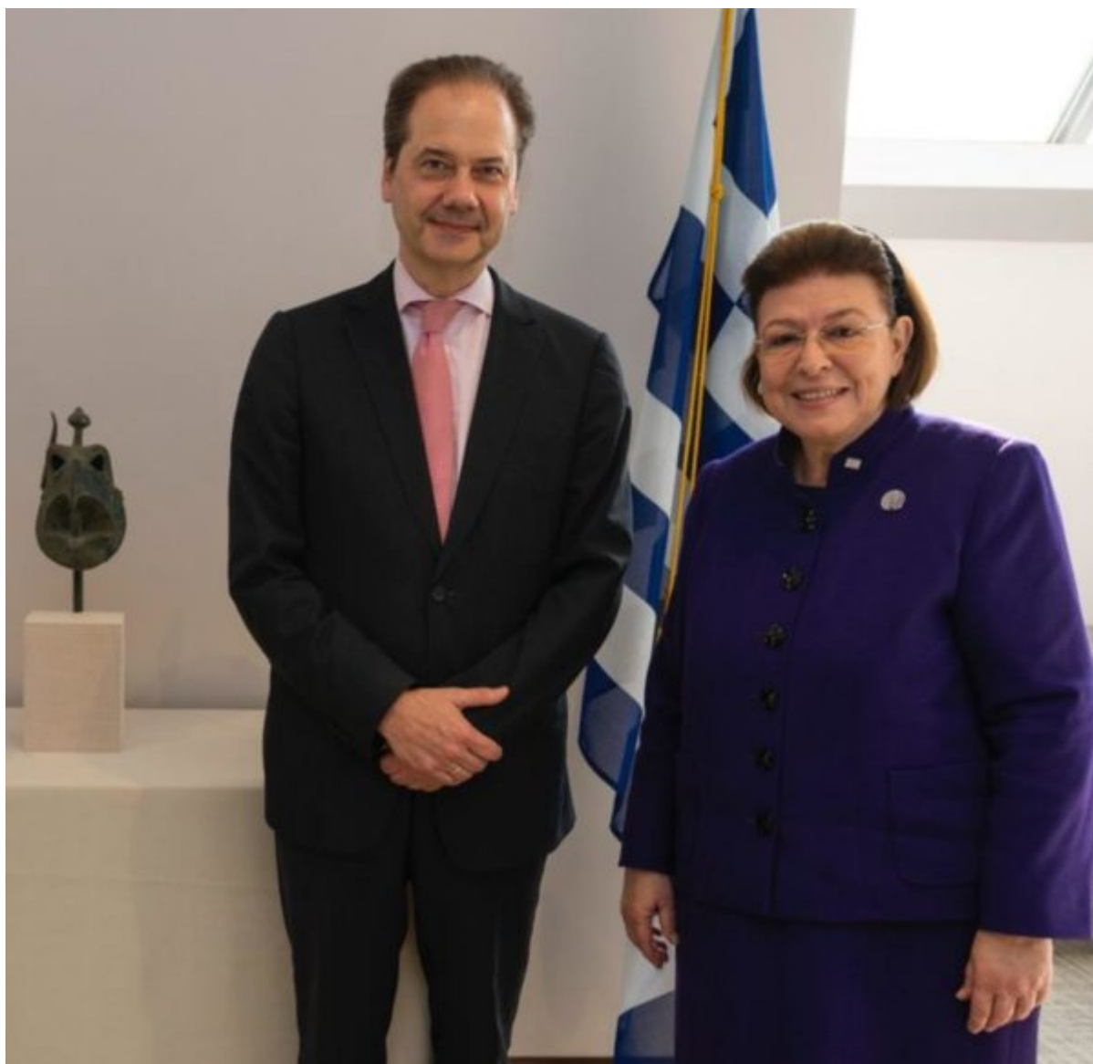
Η Λίνα Μενδώνη με τον Διευθυντή του MET Max Hollein

Η αντίστοιχη έρευνα στα αρχεία του MET επιβεβαίωσε το χρόνο κλοπής της κεφαλής, καθώς φαίνεται ότι αυτή πωλήθηκε το καλοκαίρι του 1936 από Έλληνα αρχαιοπώλη στον Αμερικανό αρχαιοπώλη J. Brummer, για να πωληθεί στη συνέχεια, το 1948, στον W. C. Baker, και να καταλήξει κατόπιν δωρεάς, το 1971, μαζί με τα υπόλοιπα αντικείμενα της Συλλογής Baker, στο Μητροπολιτικό Μουσείο της Νέας Υόρκης.