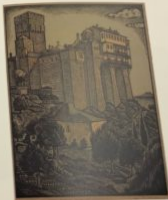
Palace, Moscow / Georgiy Melnikin and other drawings by Ministry of Education 1914 Collection / Bestand of D 10-20-00 Cultural Heritage, Friedrich-Wilhelm-Universität Preussische Historische Bibliothek