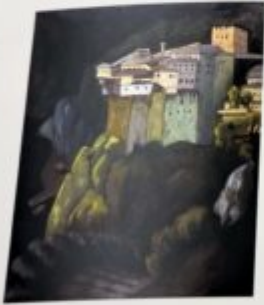
Fortifikatsioon Põhjas / Põhjalikud Regioonid 1745-1764 Linnade ja kindluste 1998 100 lehekülge, 200 illustratsioon 19,5 x 27,5 cm 1998 g Linnade ja kindluste muuseumi ja Põhjalike Regioonide Muuseumi (Linnade ja kindluste muuseumi)