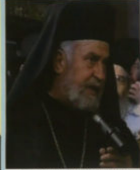
ΧΡΥΣΟΣΤΟΜΟΣ (ΠΑΠΑΔΟΠΟΥΛΟΣ) Μητροπολίτης Καρθαγένης Εκπρόσωπος του Πατριάρχου Πέτρου στην Αθήνα