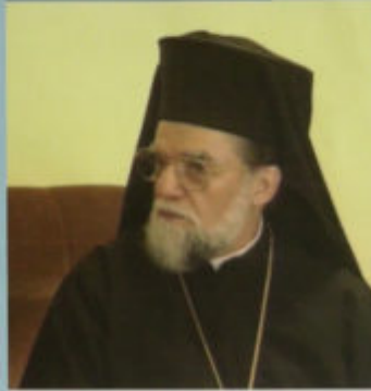
Μητροπολίτης Πηλοσίου Ειρηναίος