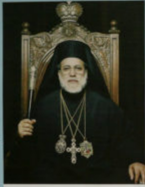
ΠΕΤΡΟΣ Ο 2' ΠΑΠΑΣ ΚΑΙ ΠΑΤΡΙΑΡΧΗΣ ΑΛΕΞΑΝΔΡΕΙΑΣ ΚΑΙ ΒΑΣΙΛΕΥΣ ΑΦΡΙΚΗΣ (1747 - 2004)

Ο ΠΑΤΡΙΑΡΧΗΣ ΑΛΕΞΑΝΔΡΕΙΑΣ ΠΕΤΡΟΣ & Η ΣΥΝΟΔΕΙΑ ΤΟΥ 11 ΣΠΕΤΕΜΒΡΙΟΥ 2004