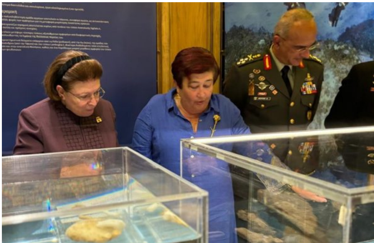
Η Υπουργός Πολιτισμού Λίνα Μενδώνη με την επίτιμη έφορο αρχαιοτήτων Αγγελική Σίμωσι

Στηρίζεται γενναιόδωρα από τα Ιδρύματα Αικατερίνης Λασκαρίδη και Αθανασίου Κ. Λασκαρίδη, καθώς και την ωρολογοποιία Hublot, και βρίσκεται στην αιχμή της διεθνούς ενάλιας αρχαιολογικής έρευνας, εφαρμόζοντας καινοτόμους και πρωτοποριακές μεθόδους και αξιοποιώντας τις τελευταίες κατακτήσεις της τεχνολογίας.