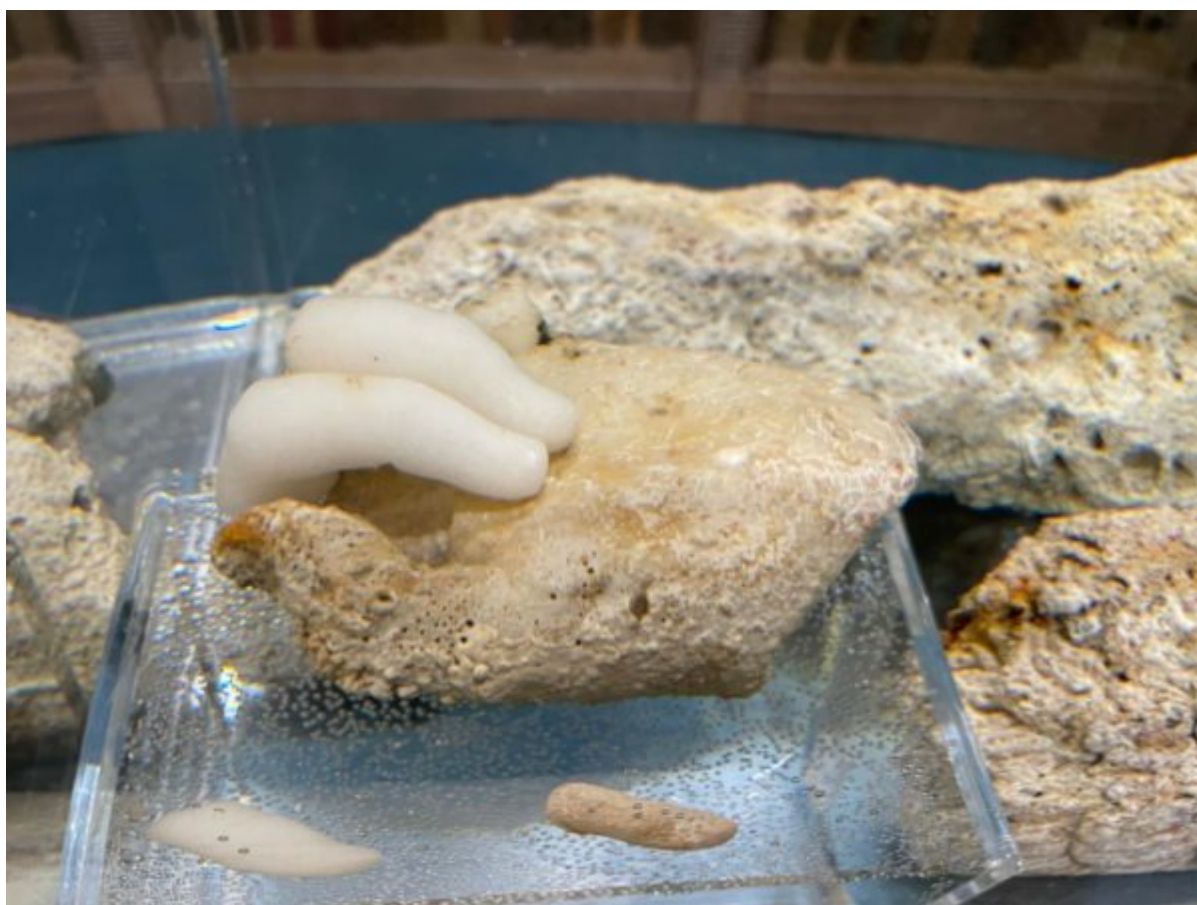
Ευρήμα από την έκθεση Επιστροφή στα Αντικύθηρα

«Το 2026, επεσήμανε η Υπουργός Πολιτισμού, μετά από καθυστέρηση πολλών δεκαετιών, το Υπουργείο Πολιτισμού θα αποδώσει το Εθνικό Μουσείο Εναλίων Αρχαιοτήτων στο ελληνικό και το διεθνή κοινό όχι πολύ μακριά από δω, στο κτήριο του ΣΙΛΟ στο Μεγάλο Λιμάνι. Είναι ένα από τα εμβληματικά έργα της κυβέρνησης του Κυριάκου Μητσοτάκη, που χρηματοδοτείται με περίπου 100.000.000 ευρώ από το Ταμείο Ανάκαμψης, και έρχεται να καλύψει ένα μεγάλο κενό στην Ιστορία, την Αρχαιολογία, την ανάδειξη και την προβολή του πολιτιστικού πλούτου των ελληνικών θαλασσών. Ας εμπνευστούμε από την ιστορία του ναυαγίου των Αντικυθήρων και τα επιτεύγματα της αρχαίας ελληνικής τεχνολογίας. Να εμπνευστούμε και να επενδύσουμε στη σύγχρονη ενάλια αρχαιολογική έρευνα. Ας συνεχίσουμε, από κοινού δημόσιος και ιδιωτικός τομέας, με την ίδια αγάπη την προσπάθεια για τη διάσωση και προβολή της πολύτιμης πολιτιστικής μας κληρονομιάς».