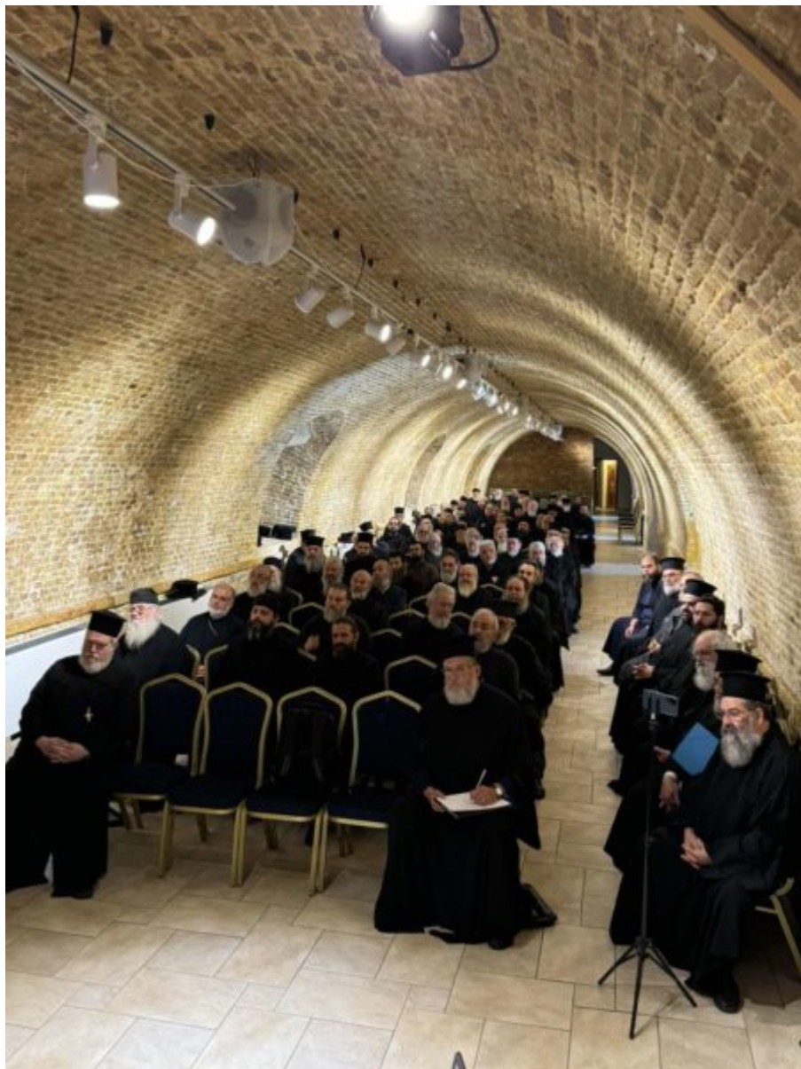
Κεντρική φωτογραφία αρχείου