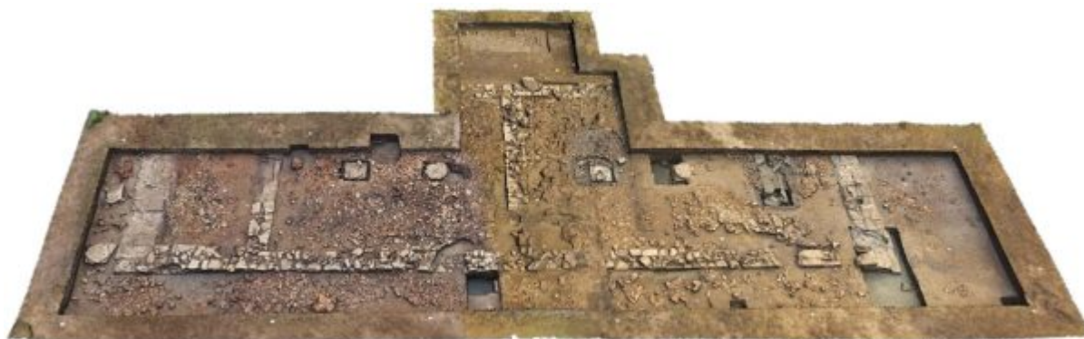
Κάτοψη του ναού στο Κλειδί (2024)

Πρόκειται για σκεύος τελετουργικού καθαρισμού που μιμείται χάλκινη λεκάνη και είχε επισκευασθεί ήδη στην αρχαιότητα, όπως φανερώνουν οι μεταλλικοί σύνδεσμοι που συγκρατούν τα θραυσμένα τμήματά του.