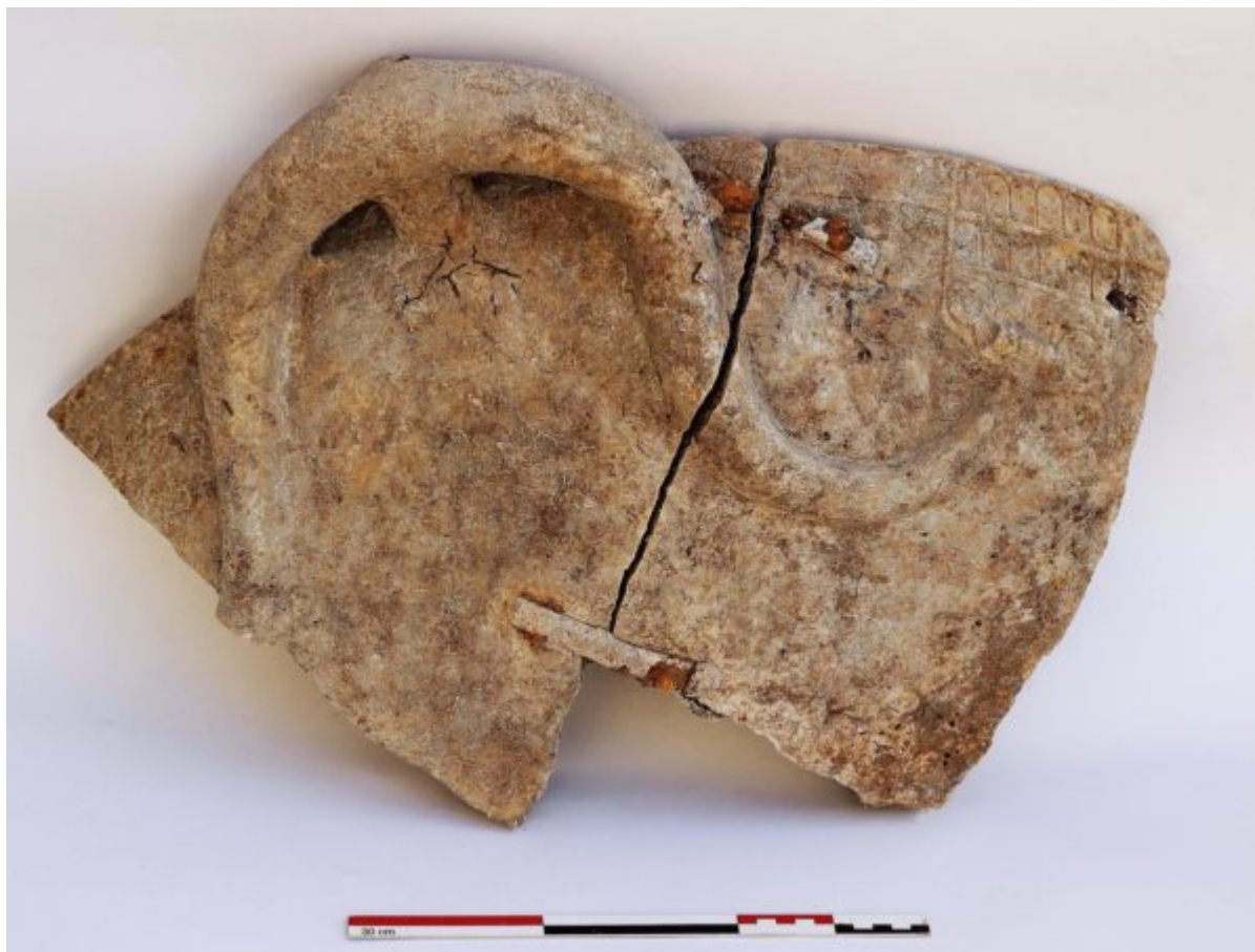
Τμήμα του μαρμάρινου περιρραντηρίου. Διακρίνεται η μία λαβή του και μεταλλικός σύνδεσμος από επιδιόρθωσή του στην αρχαιότητα

μήκος του, το οποίο ανέρχεται σε 28 μ., το δε πλάτος του είναι 9,50 μ. Ο ναός αποτελείται από δύο μεγάλους εσωτερικούς χώρους, ο καθένας με δύο εσωτερικούς κίονες στο άξονά του και από δύο προδόμους με δύο κίονες εν παραστάσι στις δύο όψεις του.