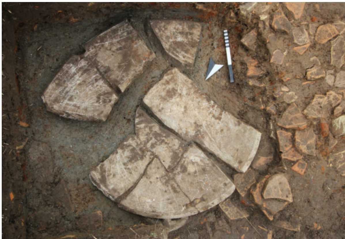
Το θραυσμένο μαρμάρινο περιρραντήριο κατά χώραν

Ο τοίχος πιθανώς αποτελεί το βόρειο άκρο του περιβόλου του ιερού του Ποσειδώνα. Σημαντική υπήρξε η συμβολή της Περιφέρειας Δυτικής Ελλάδας, που ανέλαβε τον καθαρισμό της περιοχής βόρεια του ναού από την πυκνή βλάστηση. Οι αρχαιολογικές εργασίες χρηματοδοτούνται από το Ίδρυμα Gerda Henkel και το Αυστριακό Αρχαιολογικό Ινστιτούτο της Αυστριακής Ακαδημίας Επιστημών. Τα επόμενα χρόνια η επιστημονική ομάδα σκοπεύει να συνεχίσει την έρευνα, ώστε να εντοπίσει περισσότερα στοιχεία για την έκταση και τη μορφή του ιερού και την τοπογραφία της περιοχής.