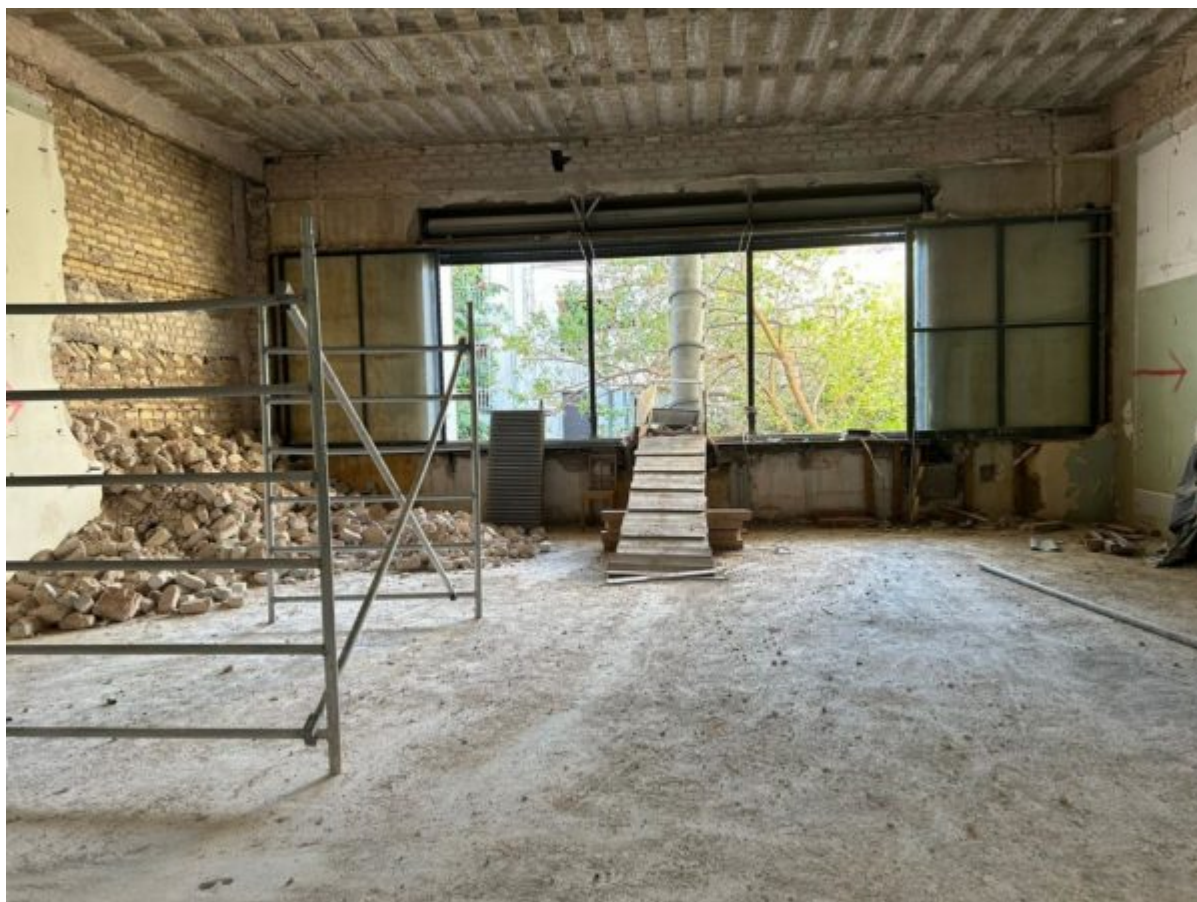
Κτήριο Κρατικής Σχολής Ορχηστικής Τέχνης

πολυδύναμου πολιτιστικού χώρου με την μετατροπή του σε Μουσείου Τυποβαφικής Τέχνης και Κέντρο Χειροτεχνίας του Υφάσματος, δημιουργώντας έναν πόλο πολιτιστικού ενδιαφέροντος, συμβάλλοντας με ένα σημαντικό τοπόσημο ανάπτυξης στην αναγέννηση μιας περιοχή της Αθήνας. Σύμφωνα με το χρονοδιάγραμμα που έχει τεθεί από την Υπουργό στις αρμόδιες υπηρεσίες του ΥΠΠΟ το έργο αναμένεται να παραδοθεί στις 31/12/2025.