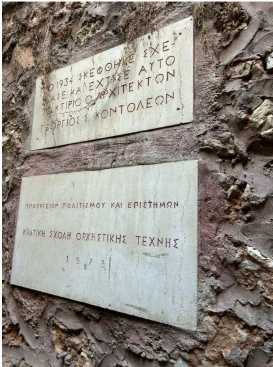
Από την αυτοψία της Υπουργού Πολιτισμού στην ΚΣΟΤ