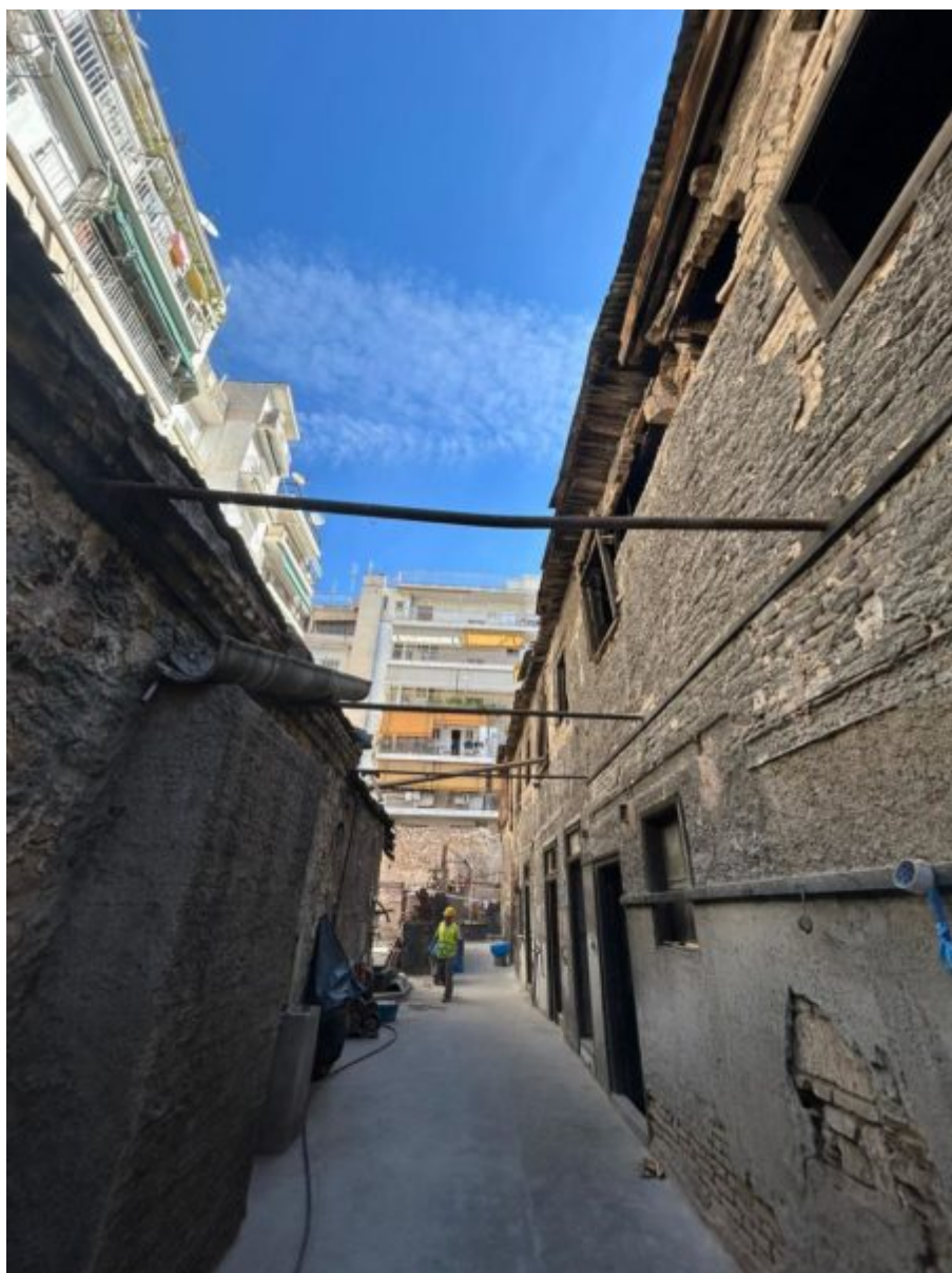
Κτήριο π. Βιοτεχνίας Ελληνικών Μαντηλιών (ΒΕΜ)