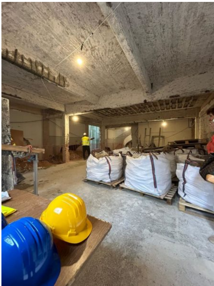
Κρατική Σχολή Ορχηστρικής Τέχνης

Το 1995, κηρύχτηκε μνημείο από το Υπουργείο Πολιτισμού όπως και το σύνολο του εξοπλισμού του, συμπεριλαμβανομένων και κινητών αντικειμένων, που αποτελούσαν μέρος της βιοτεχνικής παραγωγής. Το 1999 παραχωρήθηκε από την Κτηματική Εταιρεία του Δημοσίου στο Υπουργείο Πολιτισμού. Το 2003, το Υπουργείο Πολιτισμού προχώρησε στην εξαγορά του μηχανολογικού και κινητού εξοπλισμού του εργαστηρίου.