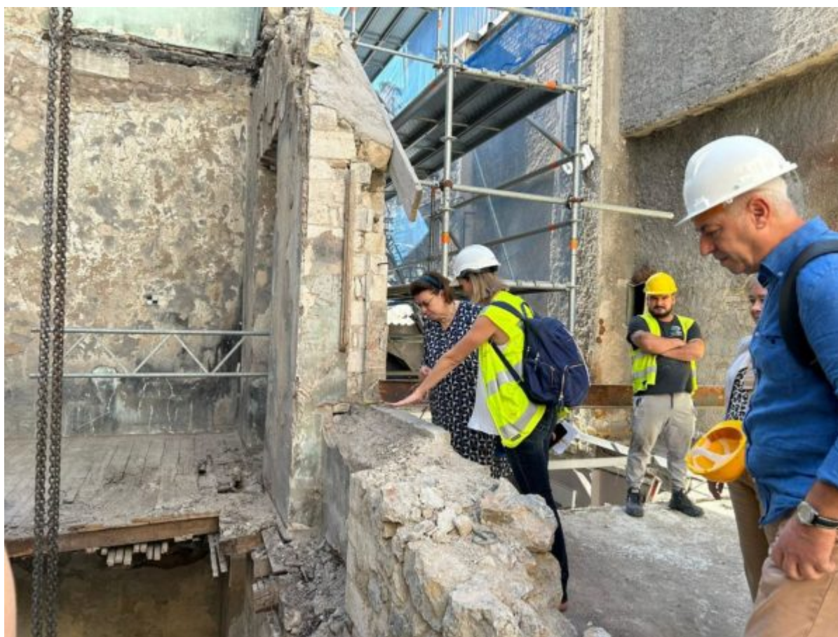
Αυτοψία στο Ελληνικό Ωδείο Αθηνών -Μέγαρο Prokesch von Osten

Το κτήριο, έργο του αρχιτέκτονα Γεώργιου Κοντολέοντα, κατασκευασμένο το 1934, είναι αμιγές δείγμα του μοντέρνου κινήματος. Σχεδιάστηκε και οικοδομήθηκε σε οικόπεδο ιδιοκτησίας της σπουδαίας Ελληνίδας χορεύτριας, χορογράφου και καθηγήτριας χορού Κούλας Πράτσικα (1899-1984) με δική της χρηματοδότηση. Προσφέρθηκε, το 1973, από την Κούλα Πράτσικα στο Ελληνικό Δημόσιο. Το 1993 χαρακτηρίστηκε από το Υπουργείο Πολιτισμού ως διατηρητέο. Σήμερα, ανήκει και στεγάζει την Κρατική Σχολή Ορχηστρικής Τέχνης, εποπτευόμενο οργανισμό του Υπουργείου Πολιτισμού.