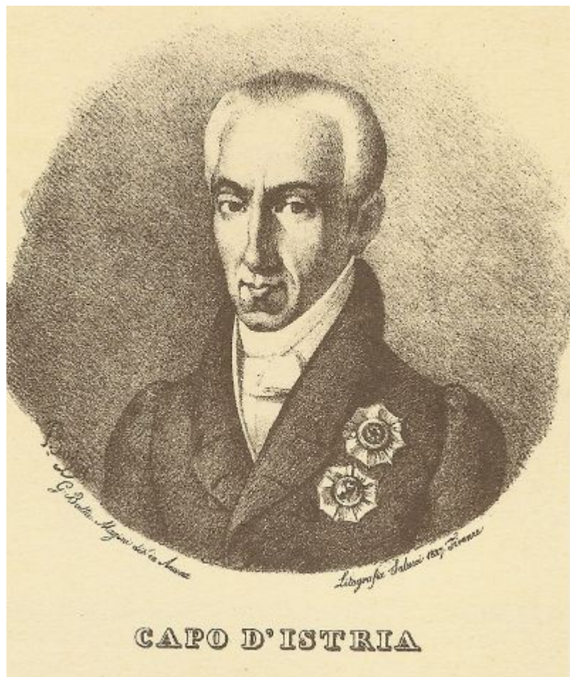
Λιθογραφία του 1827

ευδοκίμησε για πολύ. Ρύθμισε το νομισματικό σύστημα, καθότι ακόμη κυκλοφορούσαν τουρκικά και ξένα νομίσματα εντός της επικράτειας. Στις 28 Ιουλίου 1828 καθιέρωσε ως εθνική νομισματική μονάδα τον Φοίνικα και ίδρυσε Εθνικό Νομισματοκοπέιο. Στις 24 Σεπτεμβρίου του ίδιου χρόνου οργάνωσε και την πρώτη ταχυδρομική υπηρεσία.