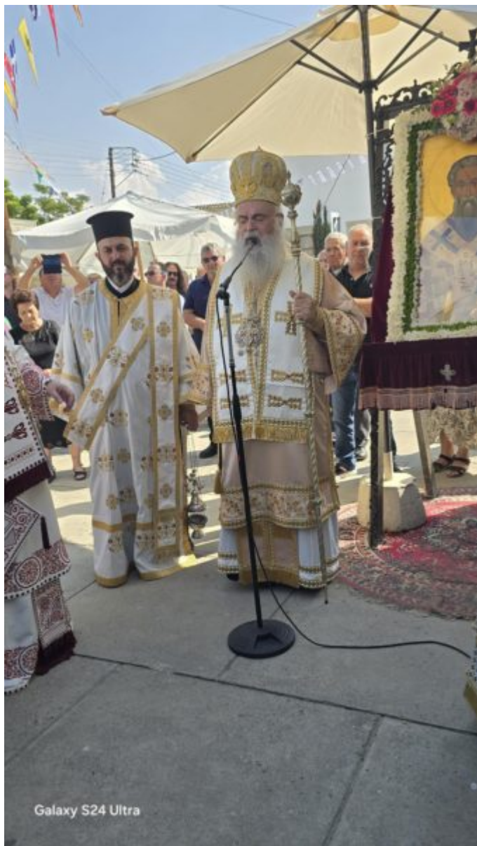
(Του Διακόνου Μιχαήλ Νικολάου)