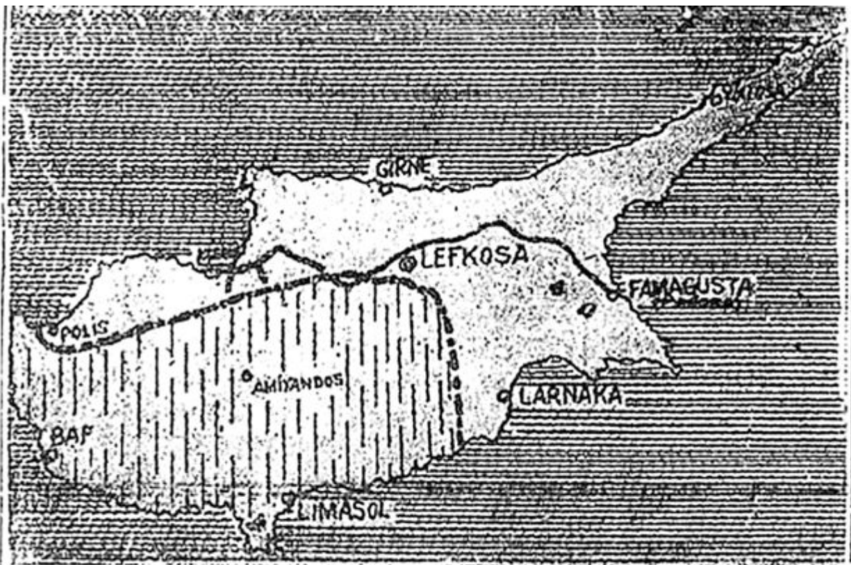
Ο χάρτης της Κύπρου, τόν οποίον δημοσίευσε χθές η «Χαλκίνη Σελί», δργασαν τοθ Δρος Κου- τσιοΐκ. Αί έπαρχίαι Λεϊκωσία, Λάρνακας, Αμμοχώστου και Κυρηνείας πληροδοτούνται τμηρι- ακώς εις τούς Τούρκους, άρριμένως γ νιασεΐρας της έρειλής περιοχής Α μισού, και Πάρου με τάς κατακορύφους γραμμάς, εις τούς Έλληνας.

Αφορμή αυτού του άρθρου φαίνεται να αποτελούσαν οι τραγικές και επικίνδυνες εξελίξεις στην Κύπρο, συνεπεία των αγγλοτουρκικών δολοπλοκιών, αφού, όπως υπογραμμίζεται, μια Πρεσβεία της Μεγάλης Μεσογειακής Δύναμης που εδρεύει σε μια αραβική χώρα πλησίον της Κύπρου, σε έκθεσή της ημ. 24 Μαΐου 1956 ανέφερε πως οι Τούρκοι της Κύπρου ενεργούν με επιδρομές κατά του ελληνικού πληθυσμού επί τη βάση προδιαγεγραμμένου σχεδίου και κατόπιν προσωπικής καθοδήγησης Τούρκων αξιωματικών, οι οποίοι από πενταμήνου βρίσκονται στην ελληνική μεγαλόνησο μεταμφιεσμένοι σε Κύπριους χωρικούς.