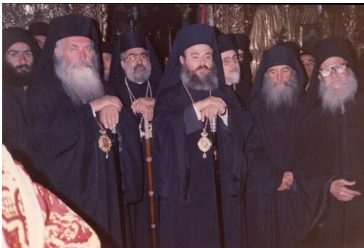
Κατά την τελετή ενθρονίσεως. Από Αριστερά οι τότε Μητροπολίτες Βεροίας κ. Παύλος (+), Κιτίου κ. Χρυσόστομος, Δημητριάδος κ. Χριστόδουλος (+) και ο Καθηγούμενος της Ι. Μ. Φιλοθέου Γέρων Εφραίμ (+).