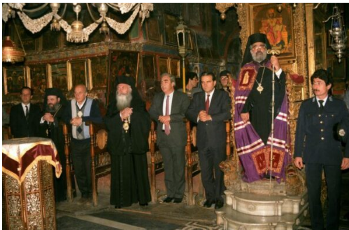
Από την υποδοχή των Εκπροσώπων της Ελληνική Πολιτείας Υπουργού Μακεδονίας Θράκης κ. Γεωργίου Τζιτζικώστα και Εσωτερικών κ. Σωτηρίου Κούβελα στο Καθολικό της Μονής.