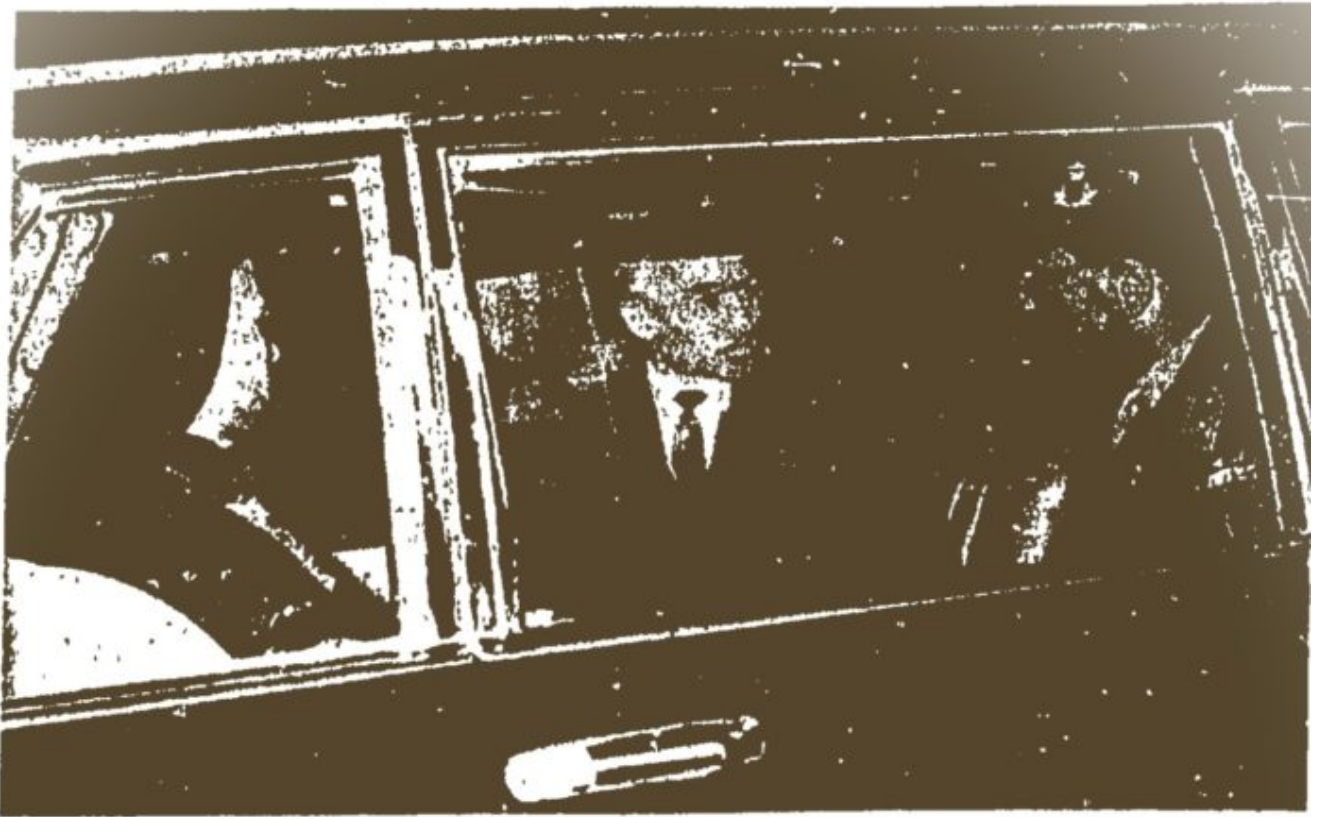
Ἡ πρώτη ληφθεῖσα φωτογραφία τοῦ Προέδρου Μαναρίου μετὰ τὴν ἀπόπειραν. Διακρίνεται ἐντὸς τοῦ αὐτοκινήτου του μετὰ τοῦ Διοικητοῦ Καταδρομῶν, ὁ ὁποῖος τὸν συνώδευσεν εἰς Μαχαιρᾶν καὶ τοῦ ἀδελφοῦ του Γιακωβῆ.