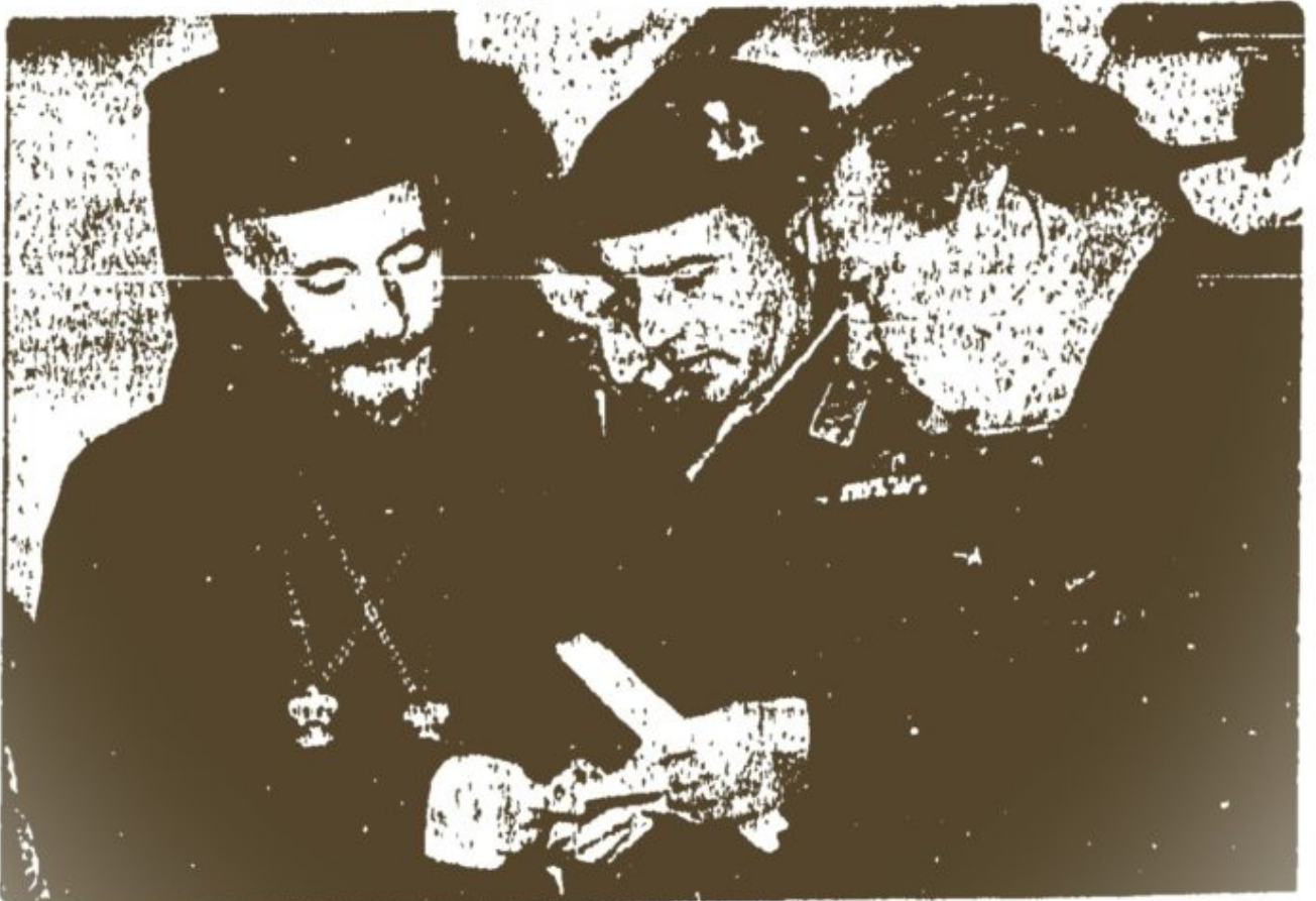
Ὁ Μαναριώτατος συνομιλῶν μετὰ τὴν ἀπόπειραν εἰς τὸν Μαχαιρᾶν μετὰ τοῦ Στρατηγοῦ Γερακίμη, τοῦ Διοικητοῦ Καταδρομῶν καὶ τοῦ Ὑπουργοῦ Ἐσωτερικῶν.