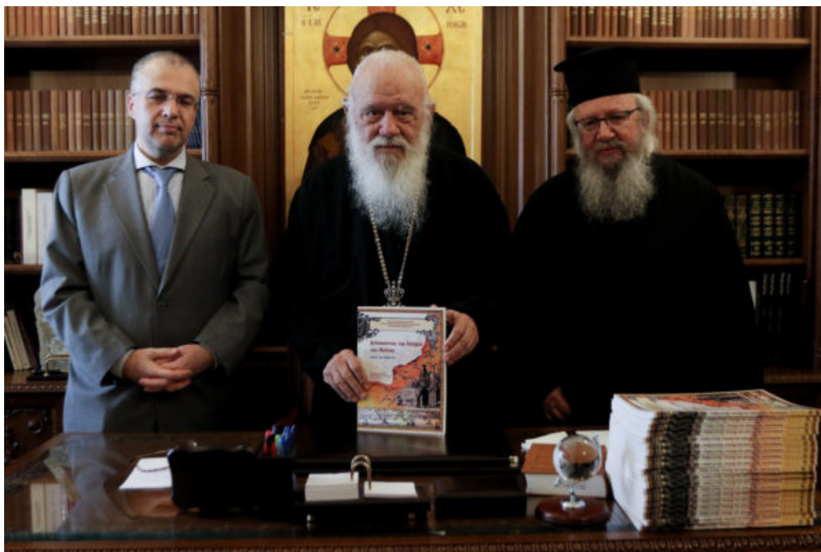
Παρουσιαση τομου της Αποστολικης Διακονιας με θεμα ΔΙΔΑΣΚΟΝΤΑΣ ΤΗΝ ΙΣΤΟΡΙΑ ΤΟΥ ΠΟΝΤΟΥ, εκδοσεις της Αποστολικης Διακονιας . Η εκδηλωση πραγματοποιηθηκε στα γραφεια της Ιερας Συνοδου κατα την οποια ο Αρχιεπισκοπος Ιερωνυμος παρελαβε τον τομο απο τον Γεν Διευθυντη της Αποστολικης Διακονιας Μητροπ.Φαναριου Αγαθαγγελο και τον Γεν Γραμματεα Θρησκευματων του Υπ.Παιδειας Γιωργο Καλαντζη