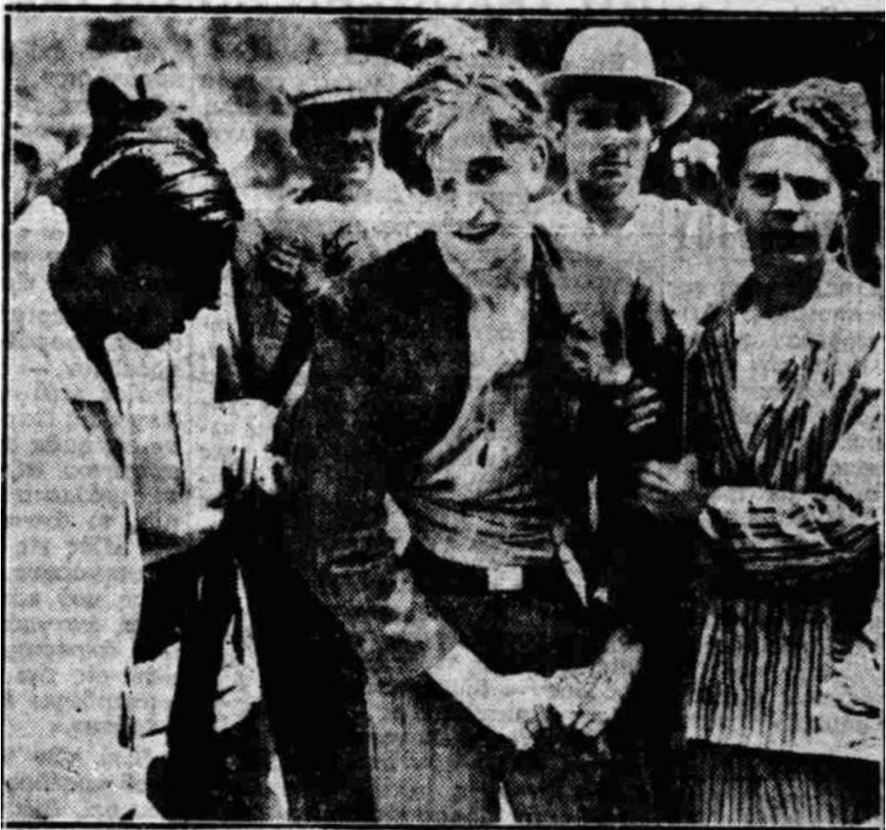
“Ένας τραυματίας φθισικός, οδηγούμενος υπό τῶν συναδέλφων του εἰς τὸν θάλαμόν του

Εφημερίδα Ακρόπολις 20.07.1932.