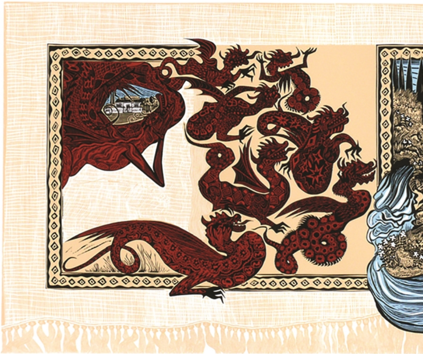
Η απειλή των δράκων