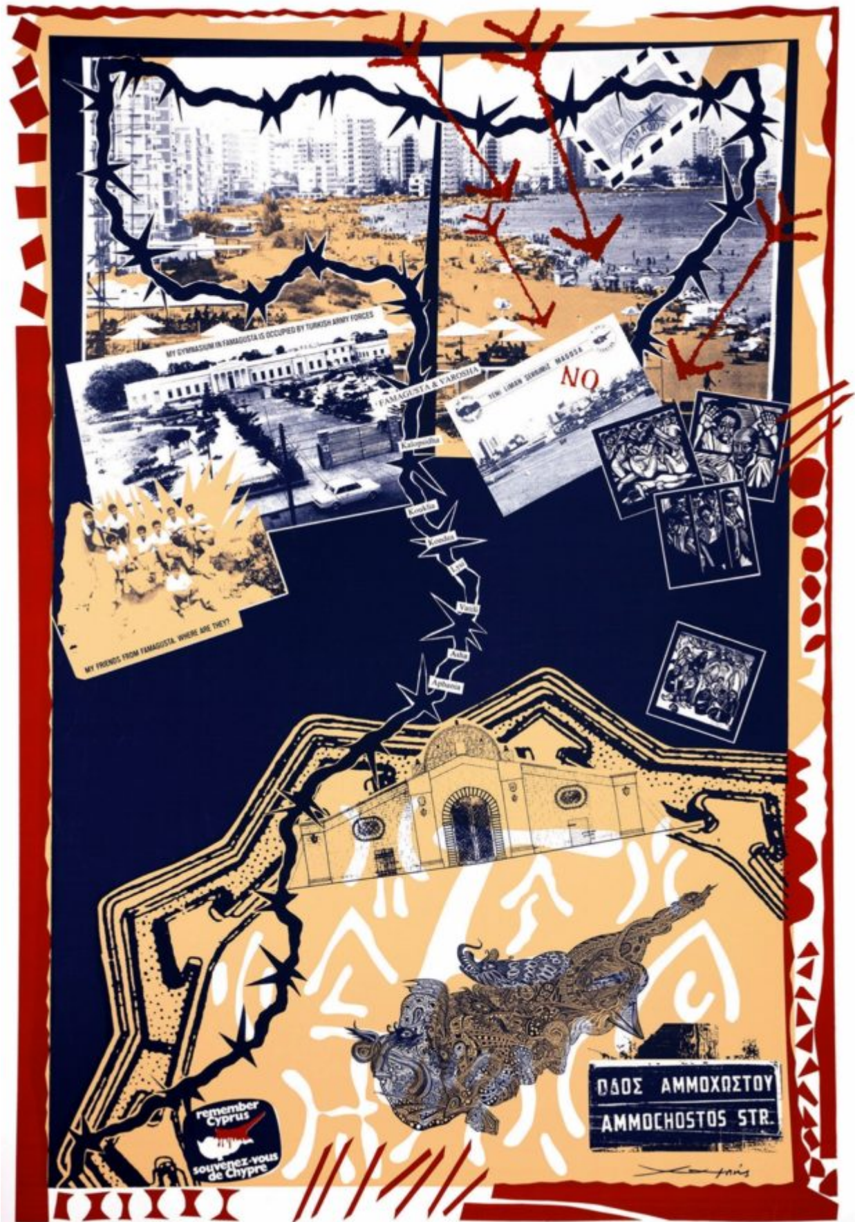
Οδός Αμμοχώστου, μεταξοτυπία