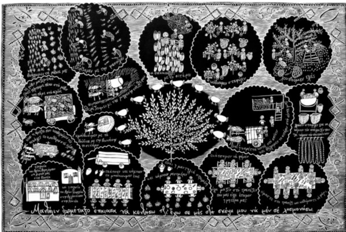
Μαντήλιν ολομέταξο της Μαργαρίτας