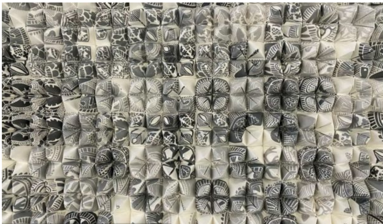
Ελένη Παναγίδου, Πέπλο, 2023, λινόγραφια, 189 x 101 εκ

Εγκαινιάζεται το Σάββατο 23 Σεπτεμβρίου στο Δημοτικό Μουσείο Χαρακτικής Χαμπή η ομαδική έκθεση με τίτλο «Ένα Παρατεταμένο Χάδι: Σύγχρονες Αναγνώσεις της Χαρακτικής».