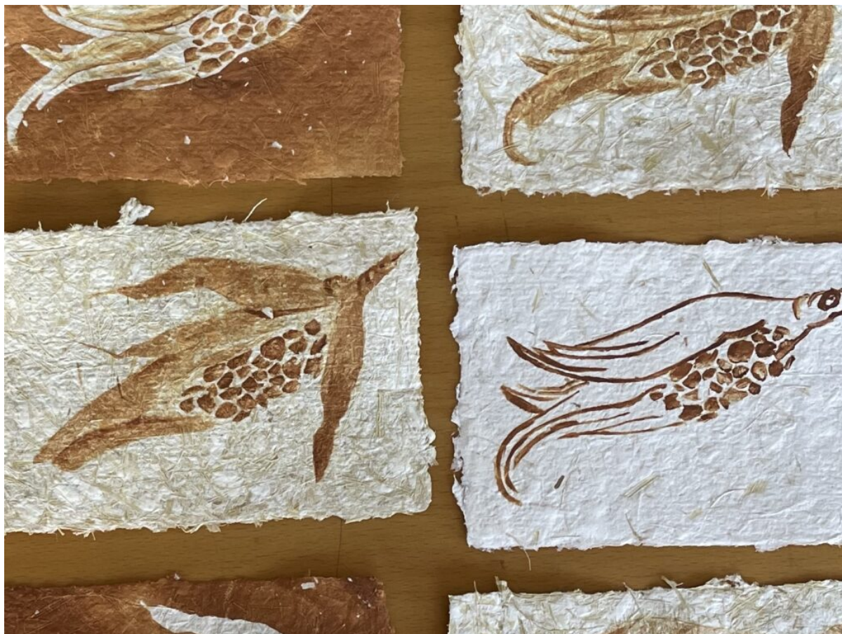
Σιμώνη Φιλίππου, σμήνος φλούδων, 2023 μονοτυπίες, chine collé σε χειροποίητο χαρτί καλαμποκιού, 10 x 15 εκ.

Σε διάλογο με έργα από τη συλλογή του μουσείου των: Κώστα Αβερκίου, Ευγενίας Βασιλούδη, Στέλιου Βότση, Κυριάκου Καλλή, Χαράλαμπου Κρασιά, Στέλλας Λάντσια, Λευτέρη Ολύμπιου, Φρίξου Παπαντωνίου, Στας Παράσκου, Μαίρης Πλάντ, Δέσπως Πρίγκη, Ρήνου Στεφανή, Στέλιου Στυλιανού, Χαμπή Τσαγγάρη, Μαριάννας Τσαγγάρου, Μιχάλη Φαντάρου, Ελένης Χατζηνεοφύτου.