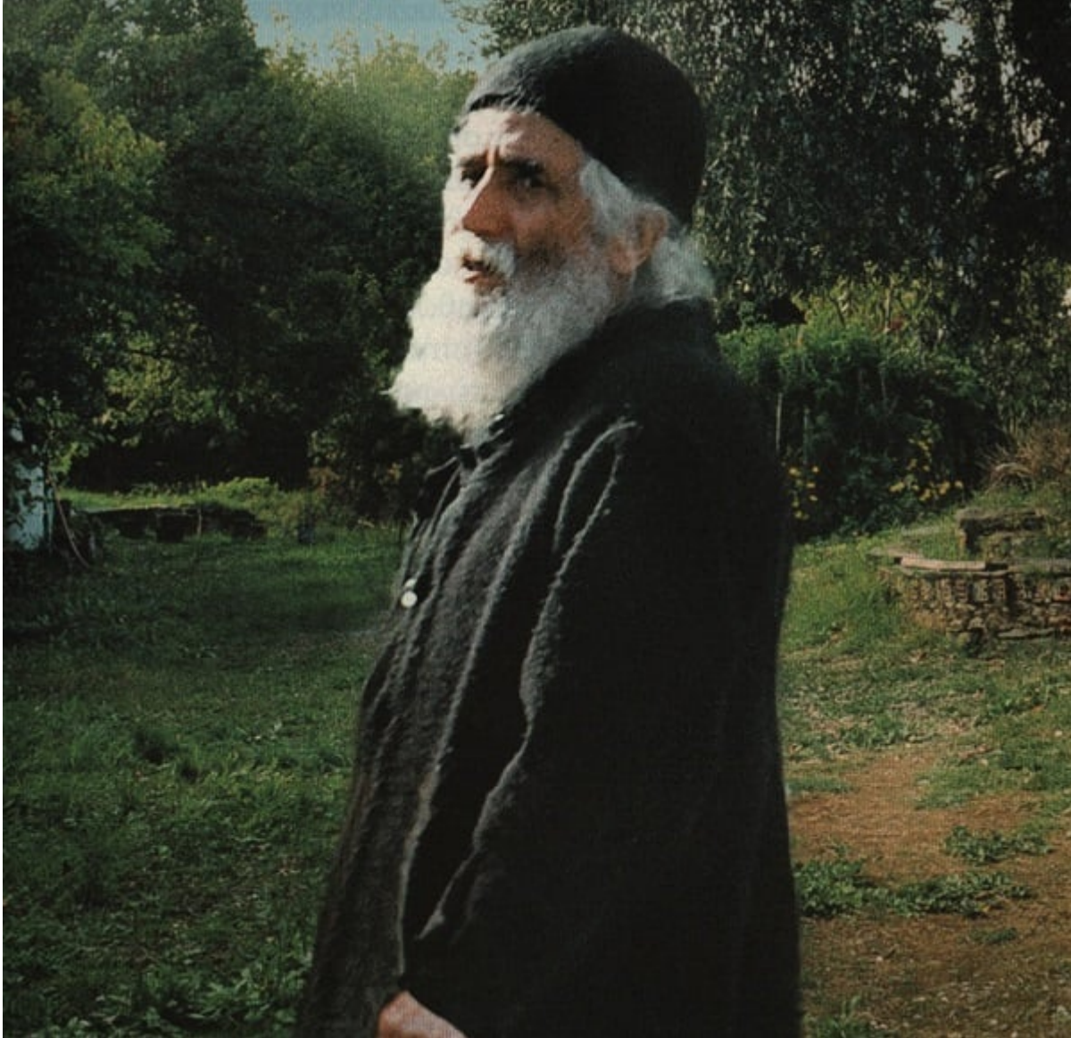
Όσιος Παΐσιος Αγιορείτης (1924-1994).

Θυμάμαι, ήταν Σεπτέμβριος μήνας, τρία-τέσσερα χρόνια πριν κοιμηθή ο Γέροντας [ο νυν όσιος Παΐσιος]. Είχαμε μαζευτεί έξω από το φράχτη του κελλιού του, γύρω στα δώδεκα άτομα. Περιμέναμε περίπου μιάμιση ώρα. Ήταν η πρώτη φορά που αργούσε τόσο πολύ να μας ανοίξει ο Γέροντας. Όταν τελικά μας άνοιξε και μπήκαμε μέσα, κάποιος αδελφός του ζήτησε να μας δη ιδιαιτέρως πέντε λεπτά τον καθένα, για να του πη το προσωπικό του πρόβλημα.