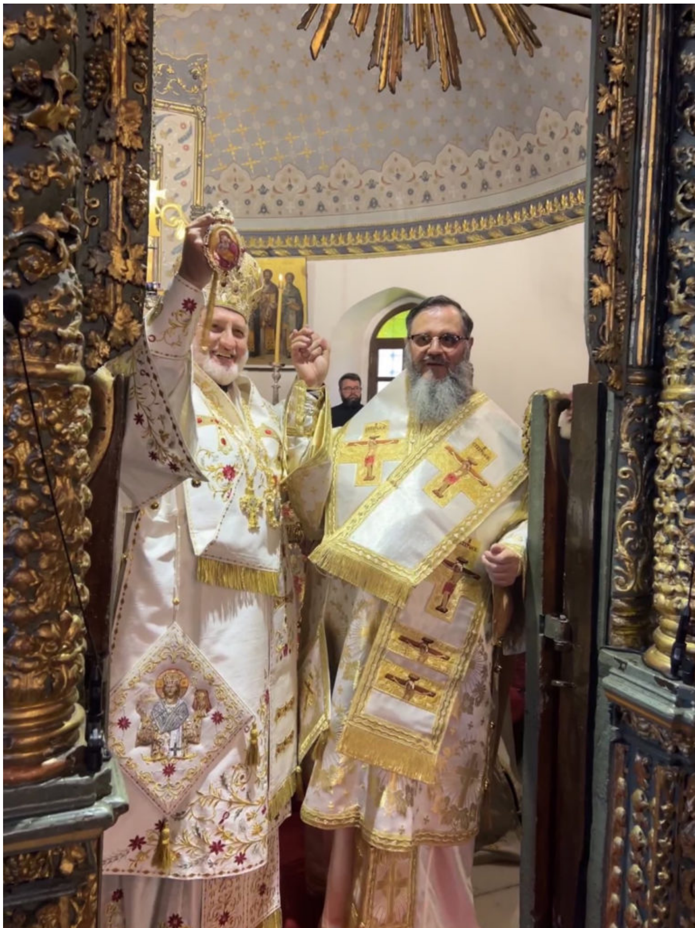
Παρέστη συμπροσευχόμενος από του Ιερού Βήματος ο Οικουμενικός Πατριάρχης Βαρθολομαίος,