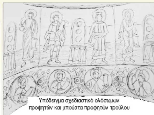
Υπόδειγμα σχεδιαστικό ολόσωμων προφητών και μπούστα προφητών τρούλου