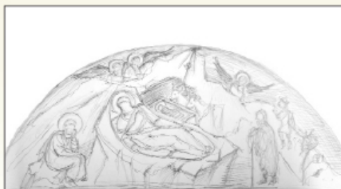
Σχεδιαστικό πρόπλασμα σύνθεσης: Γέννησις