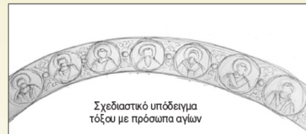
Σχεδιαστικό υπόδειγμα τόξου με πρόσωπα αγίων