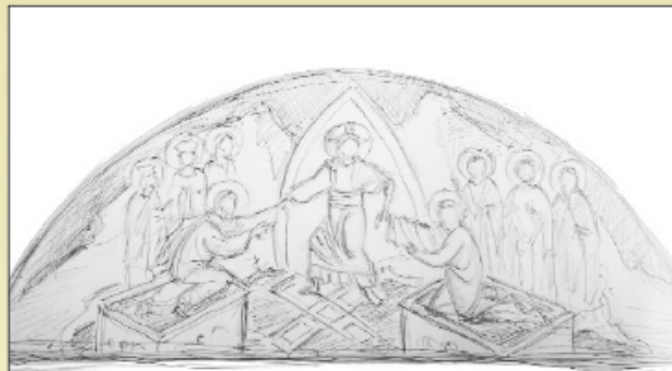
Σχεδιαστικό πρόπλασμα σύνθεσης: Η εις άδου κάθοδος