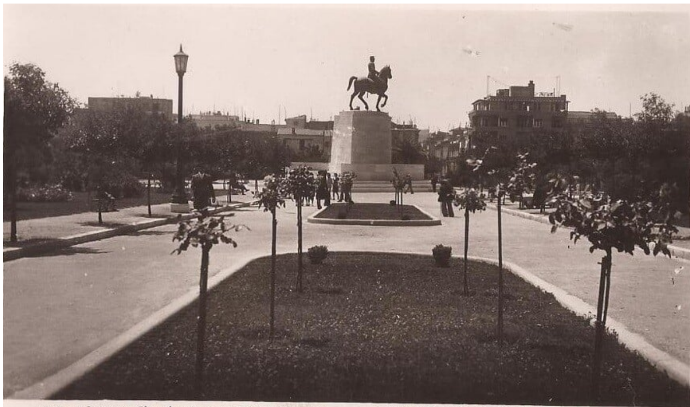
1798. ΑΘΗΝΑΙ. Εἰς τὸ πάρκον Πεδίου Ἄρεως