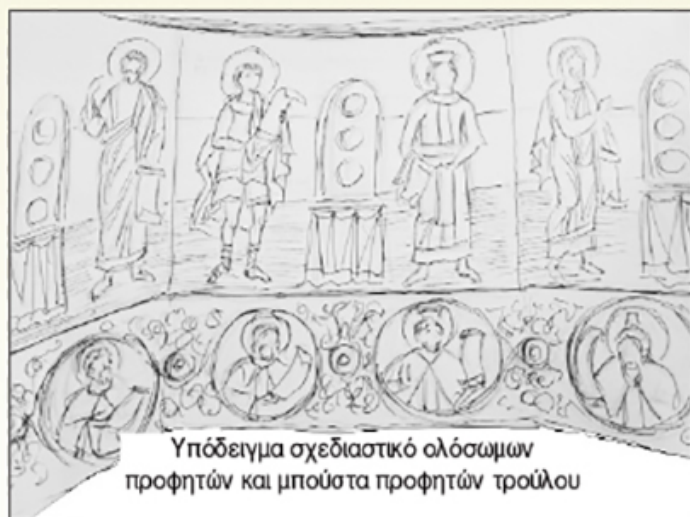
Υπόδειγμα σχεδιαστικό ολόσωμων προφητών και μπούστα προφητών τρούλου