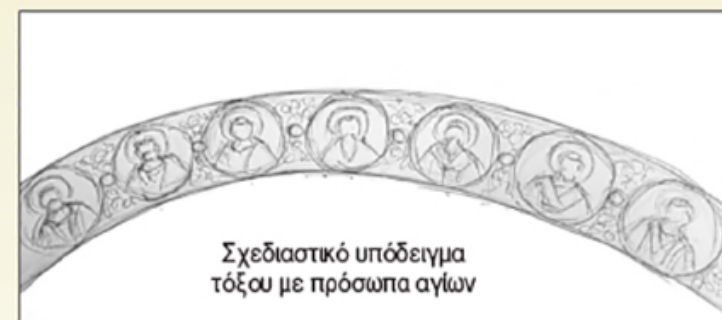
Σχεδιαστικό υπόδειγμα τόξου με πρόσωπα αγίων