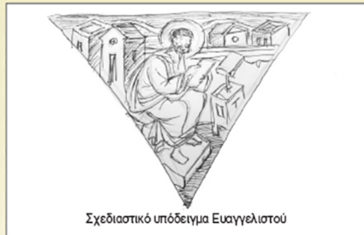
Σχεδιαστικό υπόδειγμα Ευαγγελιστού