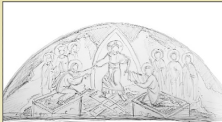
Σχεδιαστικό πρόπλασμα σύνθεσης: Η εις ἄδου κάθοδος