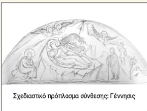
Σχεδιαστικό πρόπλασμα σύνθεσης: Γέννησις