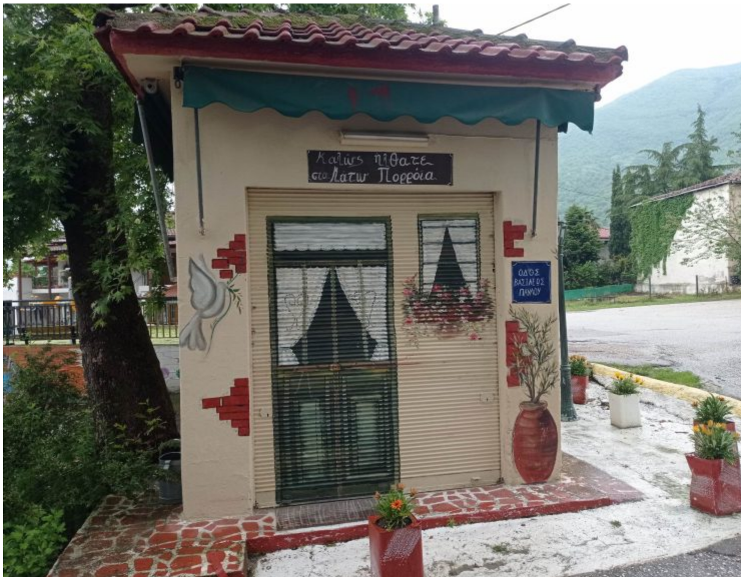
Φωτογραφικό υλικό από τις ζωγραφισμένες προσόψεις.