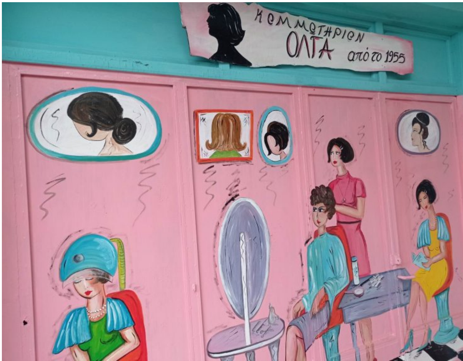
Φωτογραφικό υλικό από τις ζωγραφισμένες προσόψεις.