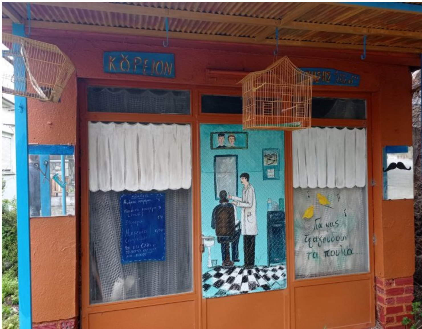
Φωτογραφικό υλικό από τις ζωγραφισμένες προσόψεις.