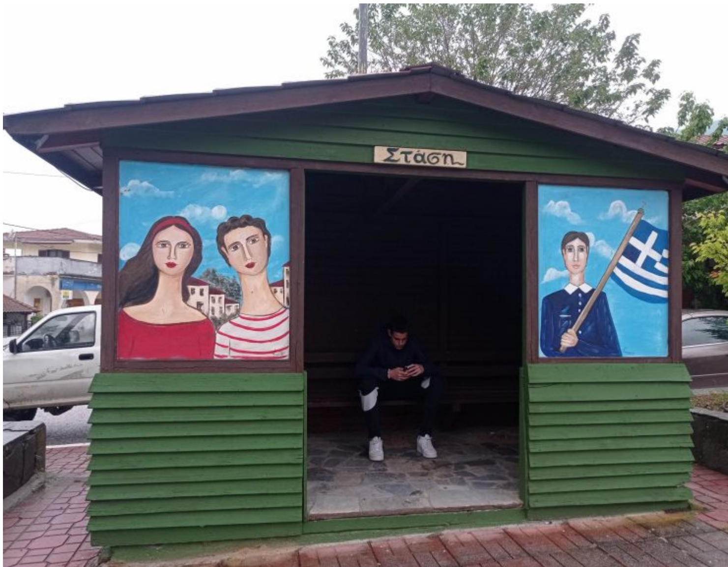
Φωτογραφικό υλικό από τις ζωγραφισμένες προσόψεις.