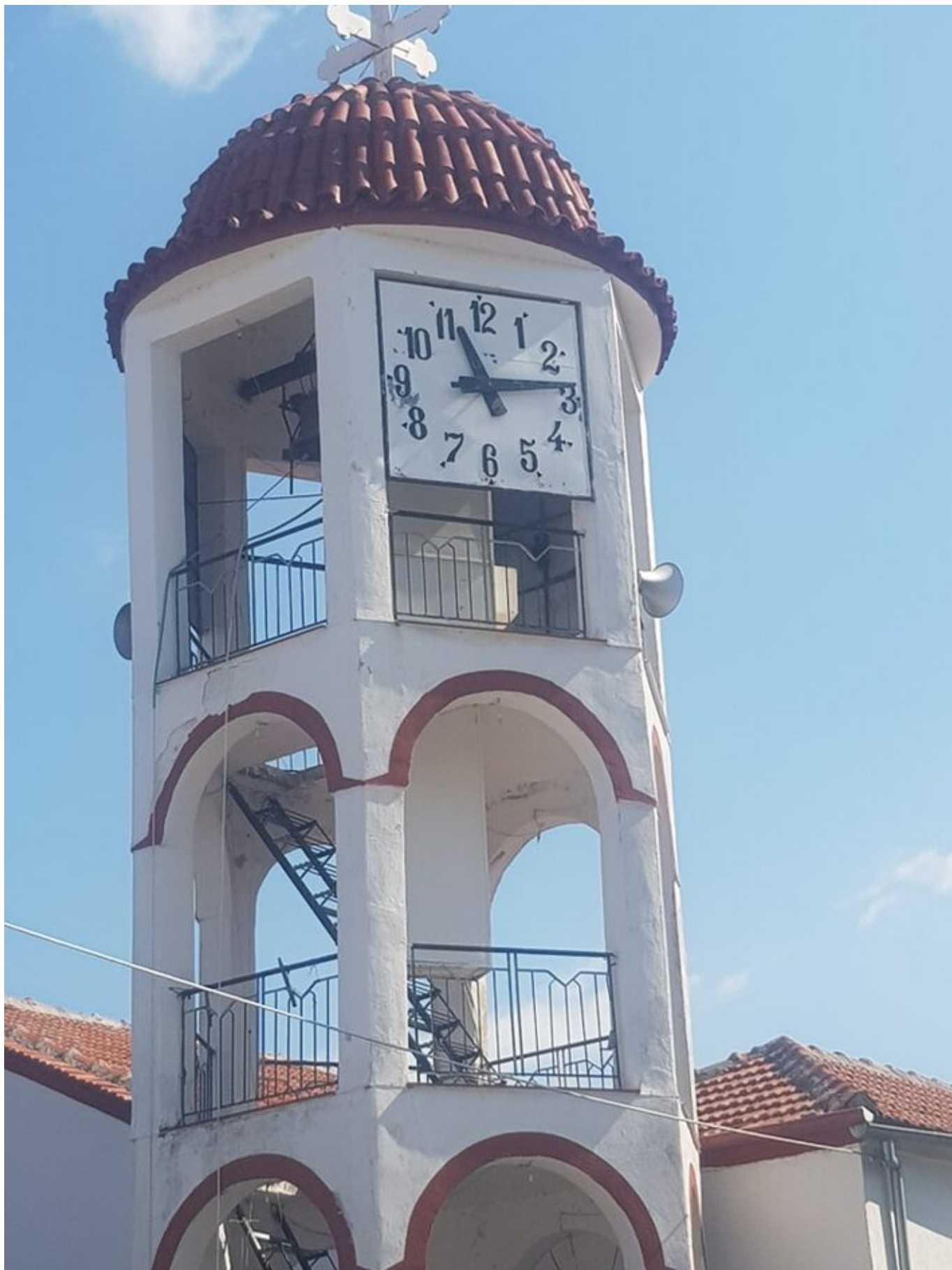
Οι τρεις ωρολογιακοί πίνακες που είναι τοποθετημένοι στον πύργο του ιερού ναού