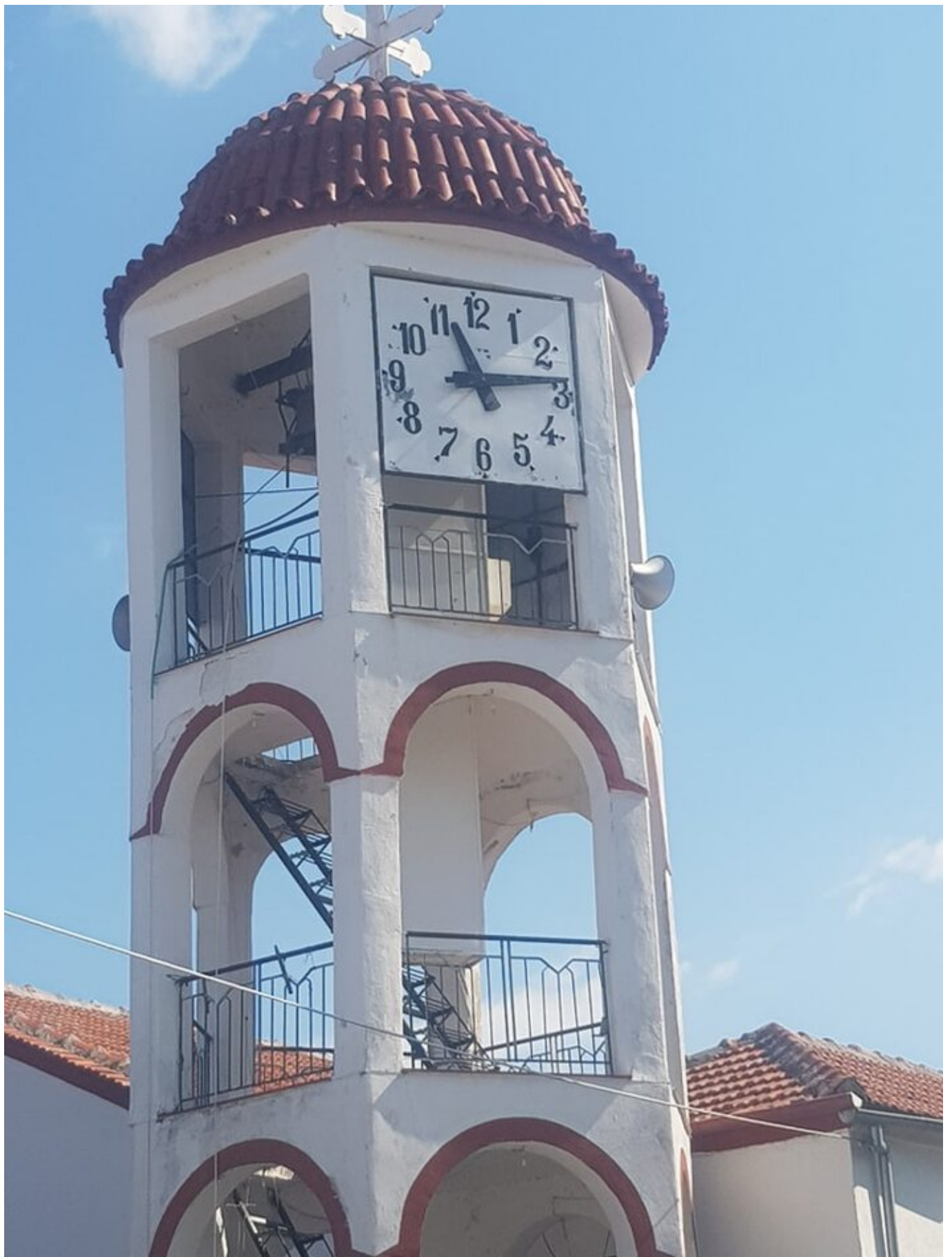
Οι τρεις ωρολογιακοί πίνακες που είναι τοποθετημένοι στον πύργο του ιερού ναού