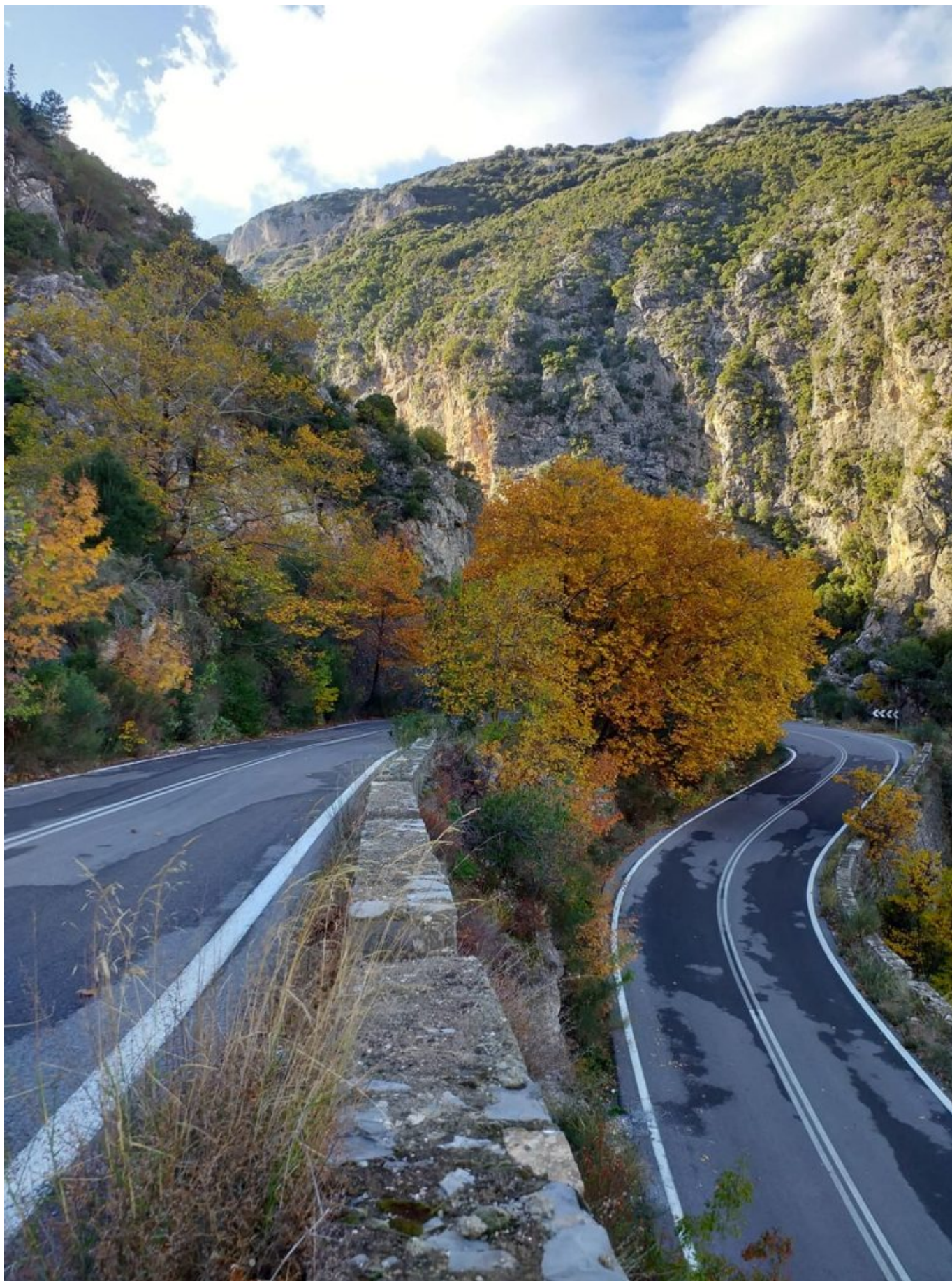
Η διαδρομή περνά μέσα από το βουνό στην κυριολεξία, τον Ταύγετο, φτάνοντας σε