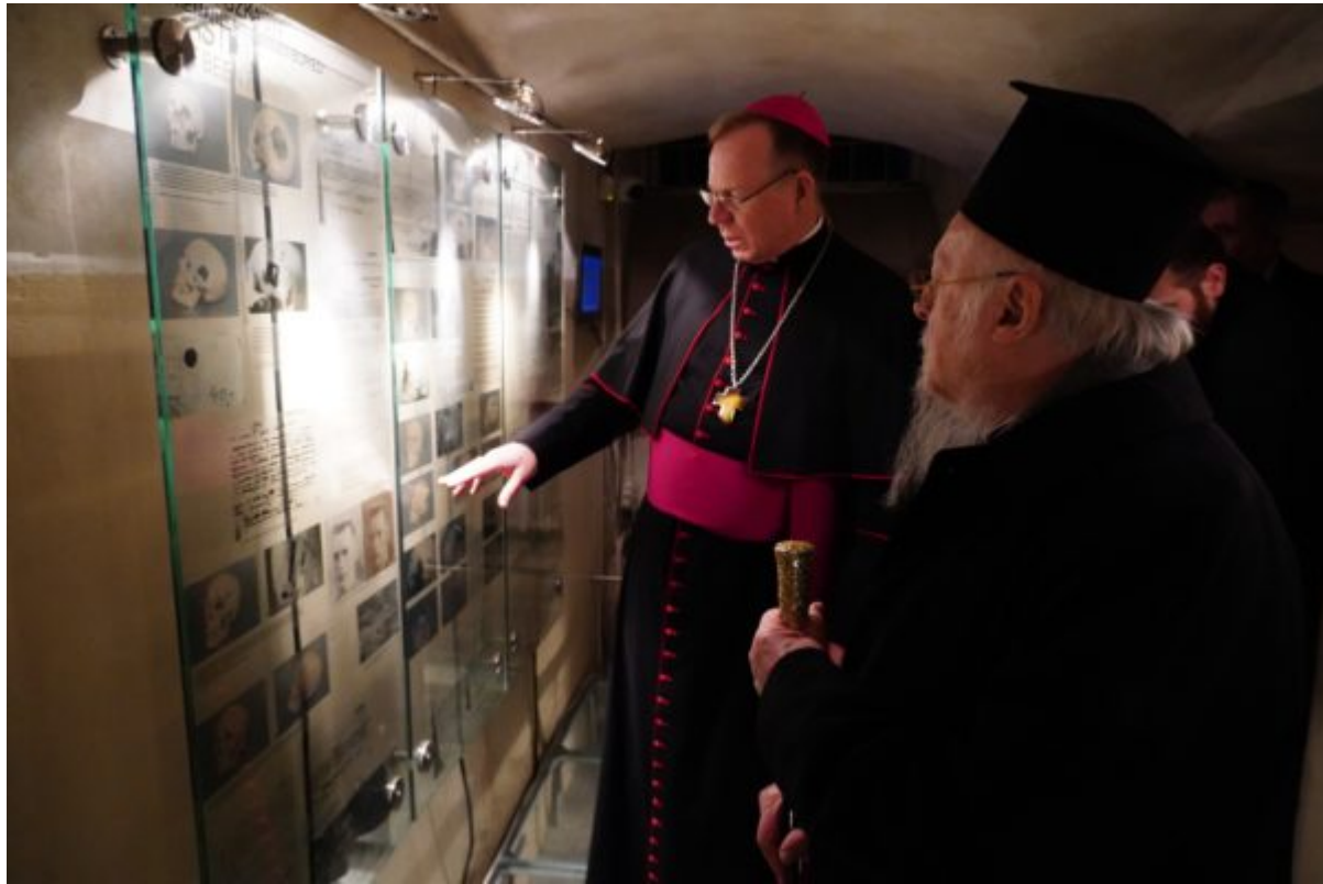
Ο Οικουμενικός Πατριάρχης, τον οποίο συνόδευσε ο ΡΚαθολικός Αρχιεπίσκοπος Βίλνιους , προσευχήθηκε για την ανάπαυση των θυμάτων.

Ὁ ἄνθρωπος δὲν ἠμωρεῖ νὰ μὴ ἀγανακτεῖται καὶ νὰ μὴ ἐπαναταστάσῃ ἡμῶς κίς τὰ φρεκτὰ καὶ ἀπάναθρονα ἄγκυκλίματα τῆς βατανικῆς ΚΓΒ καὶ ἐν γένει τοῦ ἀθεϊστικοῦ Κομμουνισμοῦ, ὃ ὁποῖος δὲν ἐσαβάρησθε ἔχει μένον τὴν δευτερίαν ἐξῆς καὶ τὴν ἑσθὺλα καὶ τὴν ἀξιοφρέσκειαν τοῦ ἀνθρωπίνου φρεσῶντος. Ὡς ἄνθρωποι ἠντιεφρόμεθα δι' ὅσα ἐνανθροπῶσι διεννήθησαν καὶ ἀτόμεσαν ἐναντίον ἐνανθροπῶντων. Ἐπρόμεθα νὰ εἶναι αἰνῖα ἡ μετῆμε τῶν θυμάτων ἐμετῶν τῶν μεγαλῶν φρεκτῶν τῆς ἰστορίας τῆς ἀνθρωπῶντος, ὡς καὶ ἐμετῶν οἱ ὁποῖοι ἠγωνίσθησαν διὰ τῶν ἐκυθέρειαν τῶν ἀνθρώπων καὶ τὴν ἀνάγκη τῶν γαῖν καὶ τῶν πρῶτων. Βλέποντες ὅσα αὐτὰ τὰ φρεκτὰ καὶ φρεκτὰ θεάγματα, ὡς διδάσκόμεθα καὶ ὡς ἀγωνίζόμεθα φρεκτὰ οἱ ἄνθρωποι νὰ μὴ το- μῶσιν φρεκτὰ τὰ ἐπαναθάβουν - ἐὰν ἴθωιν νὰ γέγωνται ἄνθρωποι. Πάσους θεῶς θεὸν ἐυχίται Ἰοκωνζαντινῶν φρεκτῶν φρεκτῶν. 22.iii.2023.