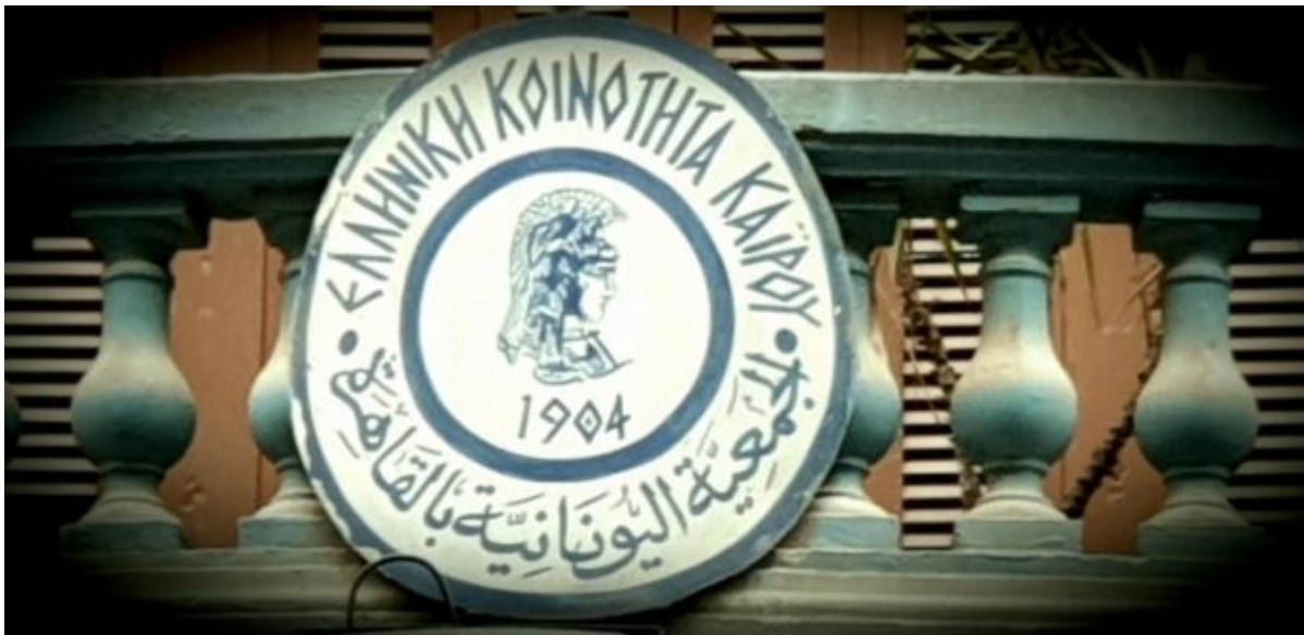
Το έμβλημα της Ελληνικής Κοινότητας Καΐρου.

Το 19ο αιώνα οι Έλληνες της Αλεξάνδρειας και έπειτα του Καΐρου άρχισαν να συσπειρώνονται σε διοικητικές δομές. Η Ελληνική Κοινότητα Αλεξανδρείας ιδρύθηκε το 1843 και του Καΐρου στην αρχική μορφή το 1856. Δημιούργησαν κοινότητες – μικρογραφία της μητέρας Ελλάδας αλλά χωρίς τις παθογένειες του Ελληνικού συστήματος. Εκκλησία, νοσοκομείο και σχολεία ήταν τα πρώτα ιδρύματα που δημιουργήθηκαν.