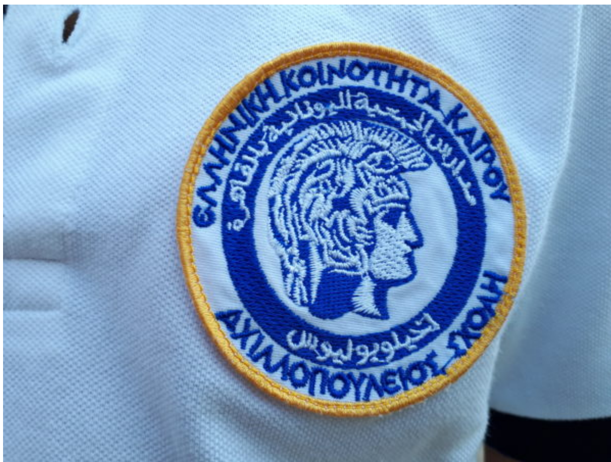
Μαθήτρια της Αχιλλοπουλείου φορά μπλούζα με το έμβλημα της Σχολής.

Σε σύντομο διάστημα μεταφέρεται στο κτίριο του Σπετσεροπούλειου Ορφανοτροφείου στην Ηλιούπολη .