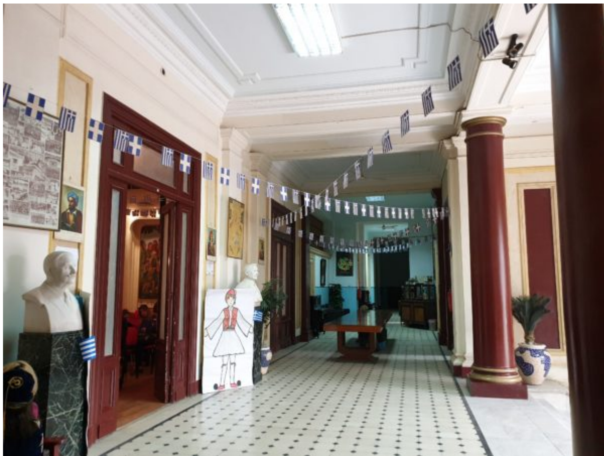
Το εσωτερικό του Σπετσεροπούλειου. Αριστερά το αμφιθέατρο όπου γίνονται οι εκδηλώσεις των μαθητών της Αχιλλοπούλειου.

Πρόκειται για ένα εντυπωσιακό νεοκλασικό κτήριο με μοναδικής αισθητικής διάκοσμο. Δίπλα ακριβώς βρίσκεται το εκκλησάκι των Εισοδίων της Θεοτόκου , του οποίου το τέμπλο έχει φιλοτεχνήσει ο Φώτης Κόντογλου στην πρώτη περίοδο της δημιουργίας του.