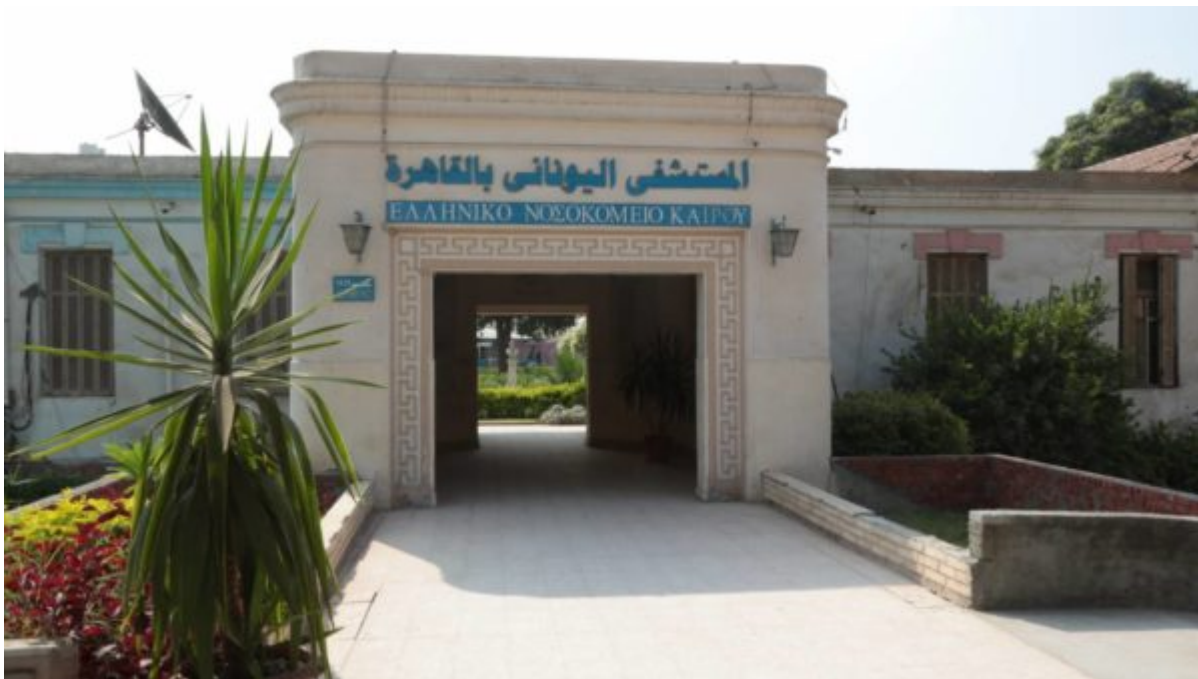
Εικόνα από το Ελληνικό Νοσοκομείο Καΐρου.