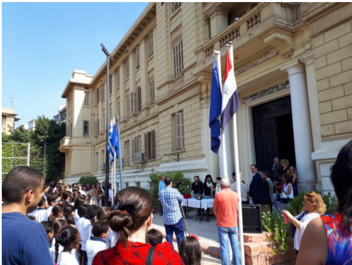
Αγιασμός στην Αχιλλοπούλειο.

Η Αμπέτειος Σχολή το αντίστοιχο ελληνικό σχολείο στο Κάιρο για αγόρια, ιδρύθηκε το 1855 από δωρεά των ελληνικής καταγωγής Σύριων ευεργετών Αδελφών Αμπέτ (Ραφαήλ, Ανανία και Γεωργίου) . Τα εγκαίνια της Σχολής έγιναν το 1861. Το Ελληνικό τμήμα μεταφέρθηκε το 1995 στο Σπετσεροπούλειο όπου και λειτουργεί το Γυμνάσιο και το Λύκειο.