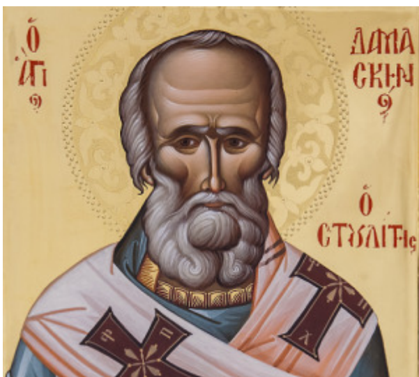
Ἅγιος Δαμασκηνὸς Στουδίτης

Γιὰ νὰ τιμήσουμε τὰ 200 χρόνια ἀπὸ τὴ Μεγάλῃ Ἑλληνικῇ Ἐπανάστασῃ τοῦ 1821, ἀξίζει νὰ θυμηθοῦμε αὐτοὺς ποὺ προετοίμασαν τὸ ἔδαφος διαφυλάσσοντας τὴ Χριστιανικὴ Πίστη, τὴν ἐθνικὴ συνείδηση καὶ τὴν ἑλληνικὴ γλῶσσα. Ἐπιλέγω πέντε φωτεινοὺς φάρους, οἱ ὁποῖοι φώτισαν τὸ Γένος κατὰ τὰ σκοτεινὰ χρόνια τῆς δουλείας.