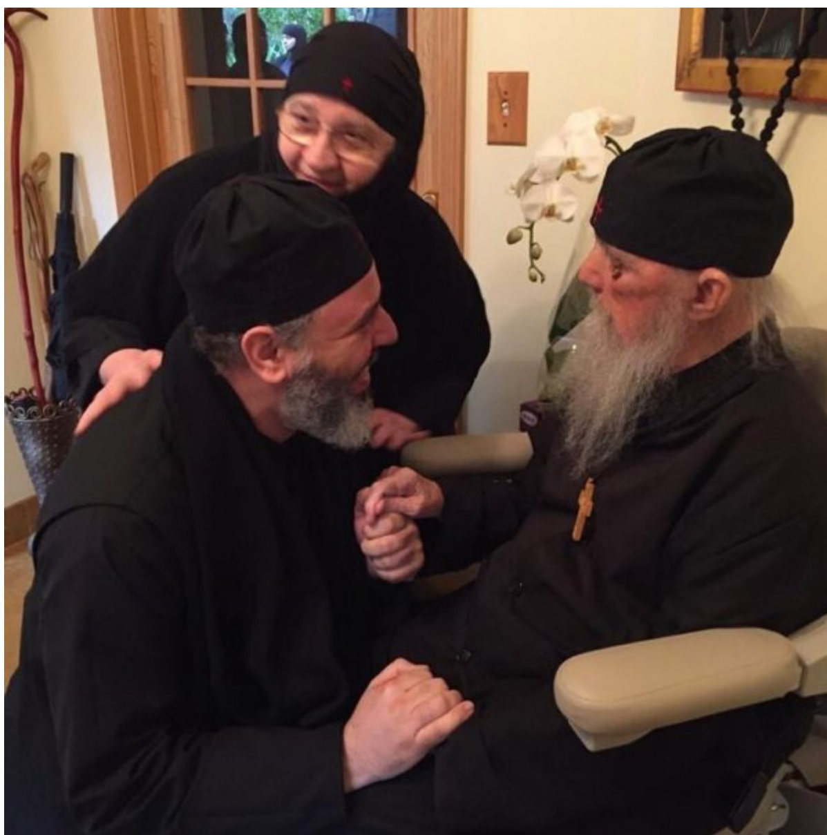
Ο Επίσκοπος Ναζιανζού με τον Γέροντα Εφραίμ

“Σήμερα, θυμόμαστε στις προσευχές μας τον Γεροντα Εφραίμ τον Φιλοθεΐτη και Αριζωνίτη, που αναχώρησε εν Κυρίω πριν τρία χρόνια. Τις ευχές του να έχουμε. Μετά τη Θεία Λειτουργία στο παρεκκλήσι του Αγίου Παύλου στην έδρα της Ελληνορθόδοξης Αρχιεπισκοπής Αμερικής, προσευχήθηκα ταπεινά για τη μνήμη του Γέροντα Εφραίμ. Είμαι για πάντα ευγνώμων και πραγματικά ευλογημένος που όταν έφτασα στη Βόρεια Αμερική πριν από πέντε χρόνια ο Γεροντας Εφραίμ με πήρε υπό την προστασία του και με καλωσόρισε στην πνευματική του οικογένεια με ανοιχτές αγκάλες και χριστιανική αγάπη. Η επίδραση που είχε στην πνευματική μου ζωή είναι ανυπολόγιστη. Να έχουμε την ευχή του!”, έγραψε ο κ. Αθηναγόρας.