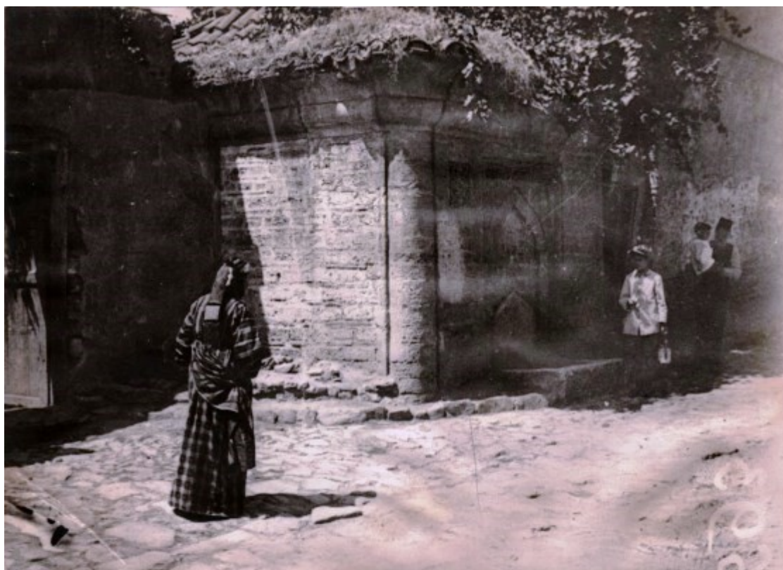
Fontaine au Cassandre