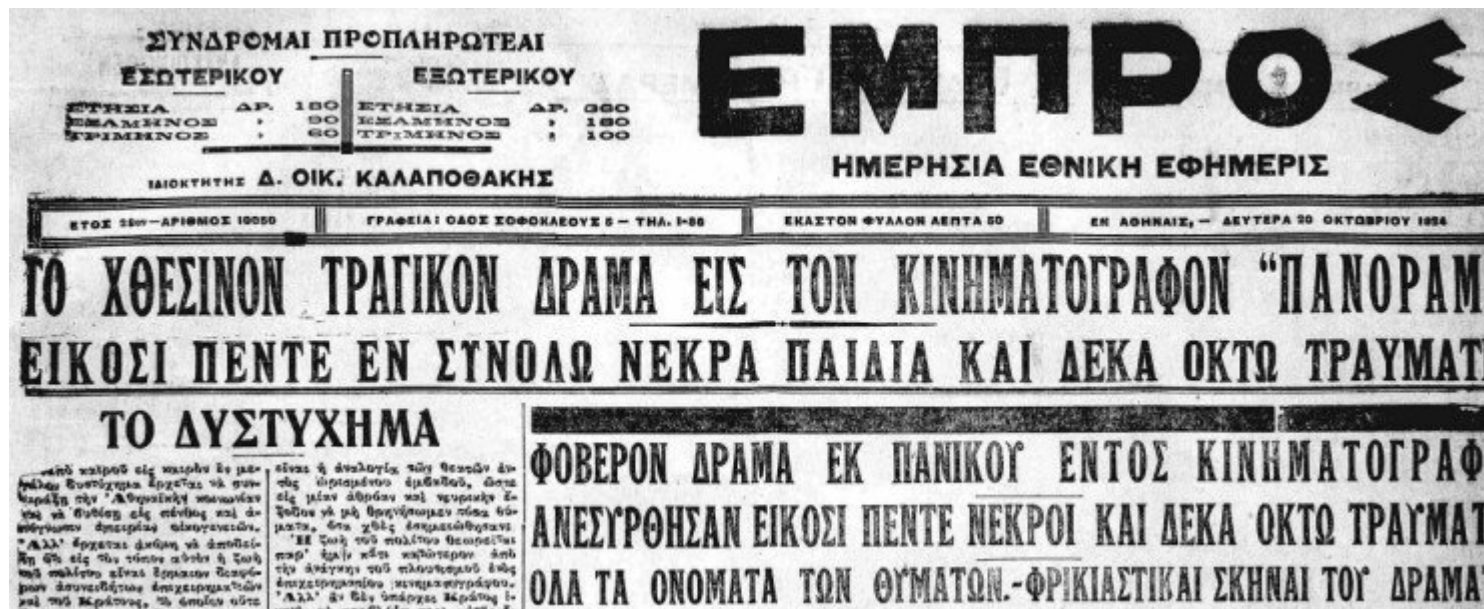
Η πρώτη σελίδα της εφημερίδας «Εμπρός» της 20ης Οκτωβρίου 1924, αναφέρεται στο τραγικό δυστύχημα στον κινηματογράφο «Πανόραμα»

κινηματογράφου αναφέρει ότι ήταν «Ο Σαρλό και ο σκύλος του», αναφερόμενος προφανώς στην κλασική ταινία «Σκυλίσια ζωή». Επειδή όμως τότε οι τίτλοι των ταινιών είχαν τριτεύοντα ρόλο έναντι του πρωταγωνιστή, θεωρούμε ότι παιζόταν η παλαιότερη ταινία του Τσάρλι Τσάπλιν «Ο πυροσβέστης», στην οποία υπήρχαν σκηνές με φλόγες.