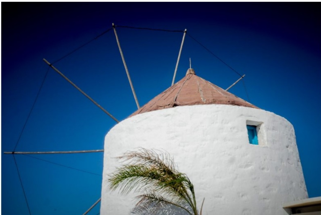
Ανεμόμυλος στο Κουφονήσι.

Μαίρη Καβάγια: «Οι νέοι αρχιτέκτονες βρήκαν αυτή την κατάσταση ως δεδομένη. Ειδικά σε νησιά με έντονες τουριστικές πιέσεις , όπως η Μύκονος , η Σαντορίνη, η Πάρος αντιμετωπίζονται με ένα πνεύμα «σύγχρονης μινιμαλιστικής» αρχιτεκτονικής που μικρή σχέση έχει με τον ίδιο τον τόπο όπου χτίζονται. Οι κατασκευές πολλαπλασιάστηκαν με ρυθμούς «λαίμαργους», απευθύνονται σε ανθρώπους που «καταναλώνουν» το ελληνικό καλοκαίρι μέσα στον ελάχιστο χρόνο παραμονής τους στα νησιά και ζητούν και επιβάλλουν την αρχιτεκτονική των «ανέσεων» και της πολυτέλειας χωρίς καν να αγγίξουν το πνεύμα και τον πολιτισμό του κάθε τόπου.