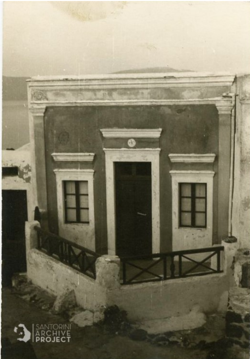
Σπίτι στη Σαντορίνη.