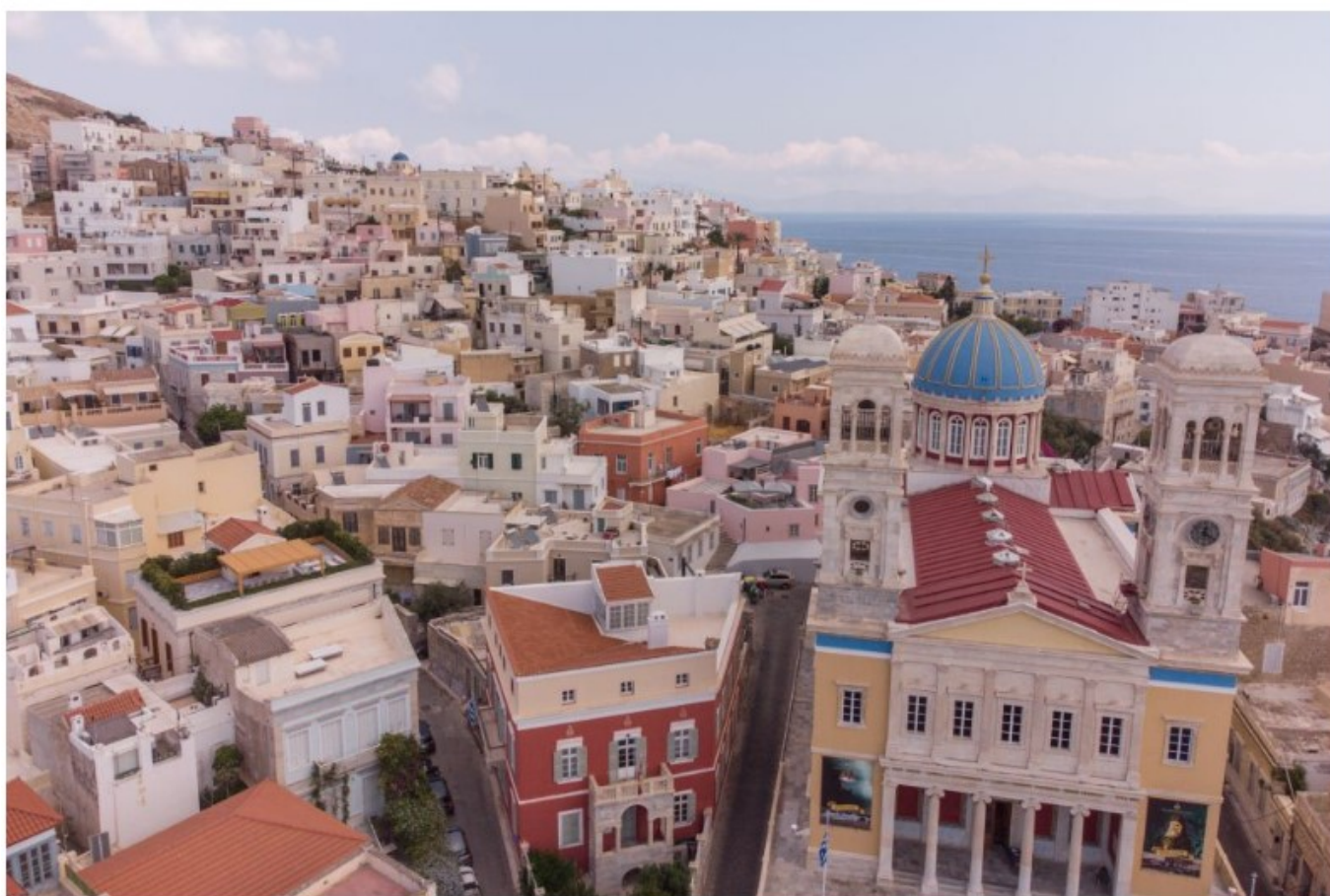
Η πρωτεύουσα της Σύρου, Ερμούπολη.