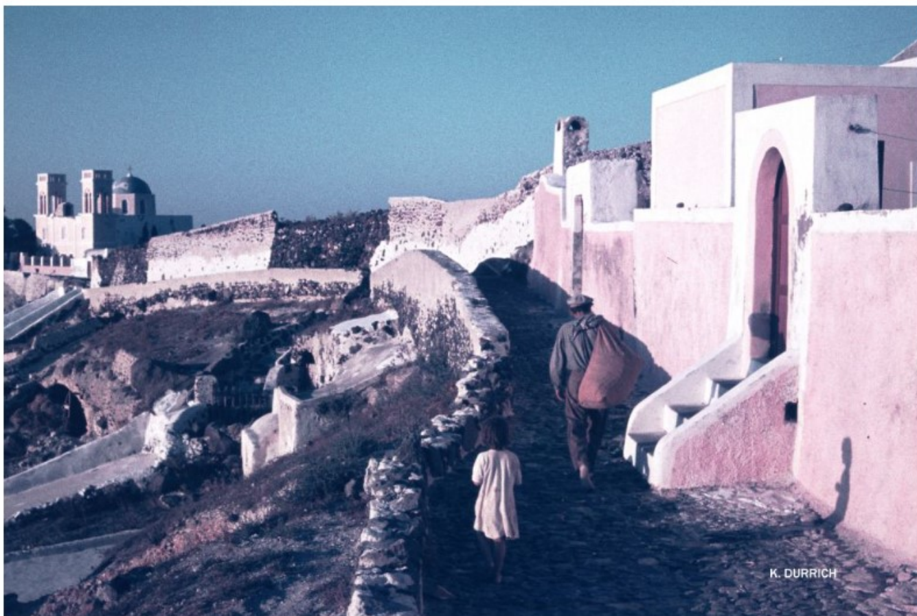
Η Σαντορίνη πριν την επέλαση του άσπρου.