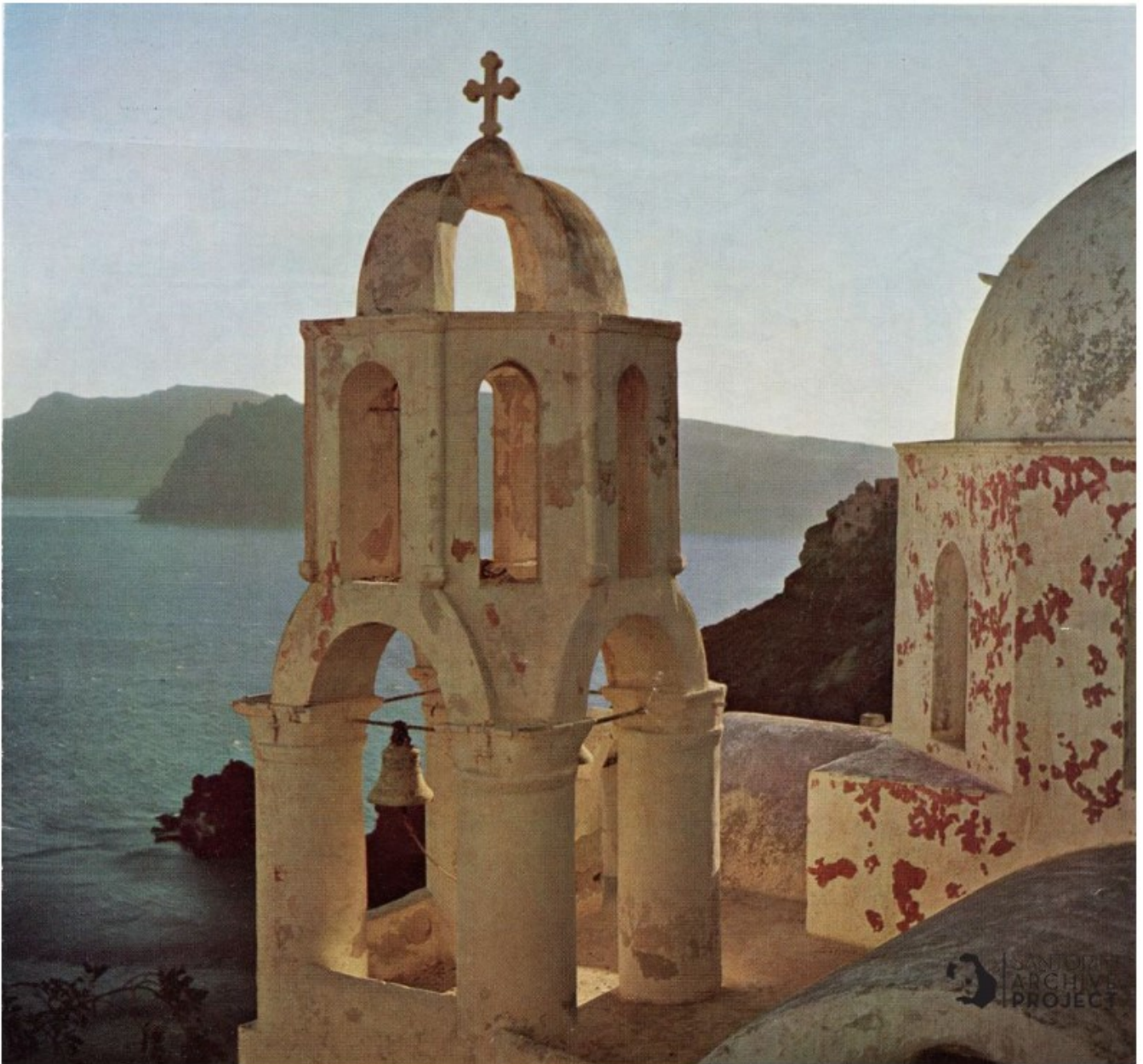
Εκκλησία στη Σαντορίνη. Το κόκκινο χρώμα φαίνεται ακόμα.

Μαίρη Καβάγια: «Τα κτίρια του 19ου και αρχών 20 αι., αυτά που λέμε γενικευμένα «νεοκλασσικά», όπως και αρκετά από τα λαϊκά σπίτια είχαν χρώματα, αλλά αυτά είχαν βάση τον ασβέστη και τα οξειδία που προέρχονταν από την γη (χοντροκόκκινο, λουλάκι, ώχρα, φούμο). Έτσι τα χρώματα αναμειγμένα στον σοβά ήταν γαιώδη και αποκτούσαν με την πάροδο του χρόνου, ήπιους γλυκούς τόνους».