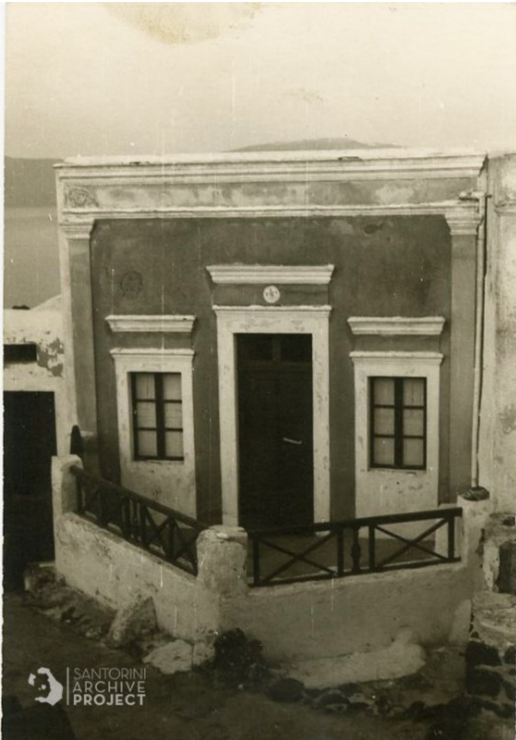
Σπίτι στη Σαντορίνη.

Μαίρη Καβάγια: «Το δ/γμα του Μεταξά του 1938 αφορούσε στα κτίρια που ανήκαν στην κατηγορία της «λαϊκής» αρχιτεκτονικής (κατά την ορολογία της εποχής) και ένας από τους σκοπούς του ήταν η επιβολή της καθαριότητας και της απολύμανσης λόγω ενδημούντων ασθενειών (φυματίωση, χολέρα, τραχώματα κα) σε αυτούς τους φτωχούς και απομονωμένους τόπους.