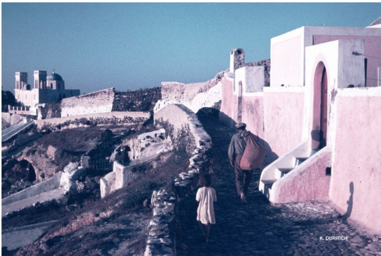
Η Σαντορίνη πριν την επέλαση του άσπρου.