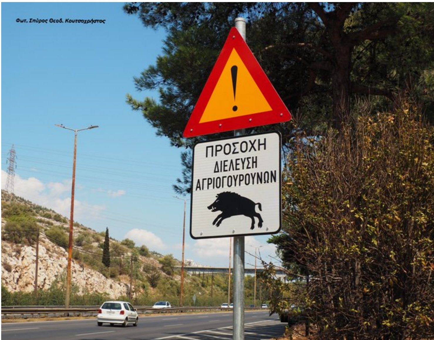
OLYMPUS DIGITAL CAMERA

Στην Κηφισιά, την Πεντέλη, τον Διόνυσο, το Ντράφι, την Μάνδρα - Αγία Σωτήρα και τα Βίλια, κάνουν συχνές εμφανίσεις στον αστικό ιστό, με τα γνωστά σε όλους προβλήματα στην οδική ασφάλεια και την δημόσια υγεία, καθώς τα οικιακά απορρίμματα που βρίσκονται εκτός των κάδων είναι μέρος της διατροφής τους.