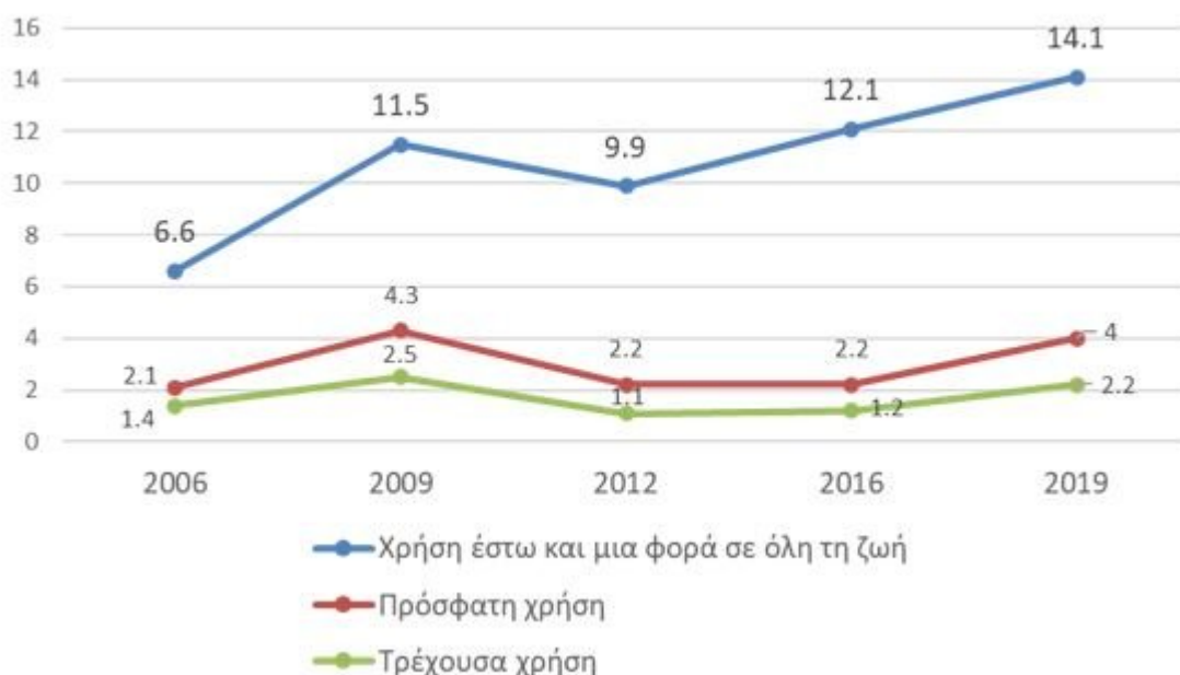
Επικράτηση της χρήσης κάνναβης (%) ανά έτος

Τα ψηλότερα ποσοστά χρήσης της ουσίας κατά τον τελευταίο μήνα εντοπίζονται ανάμεσα σε νέους/ες 19-25 ετών, το οποίο φτάνει στο 6%, σε σύγκριση με το 2,2% του συνόλου του πληθυσμού.