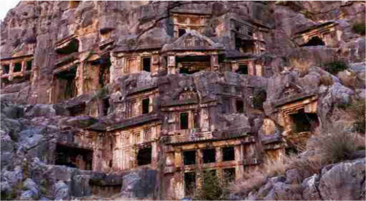
Τάφοι στα Μύρα

Ένα από τα πιο ενδιαφέροντα στοιχεία του πολιτισμού τους είναι οι λαξευτοί τάφοι και χρονολογούνται τον 5ο αιώνα π.Χ.