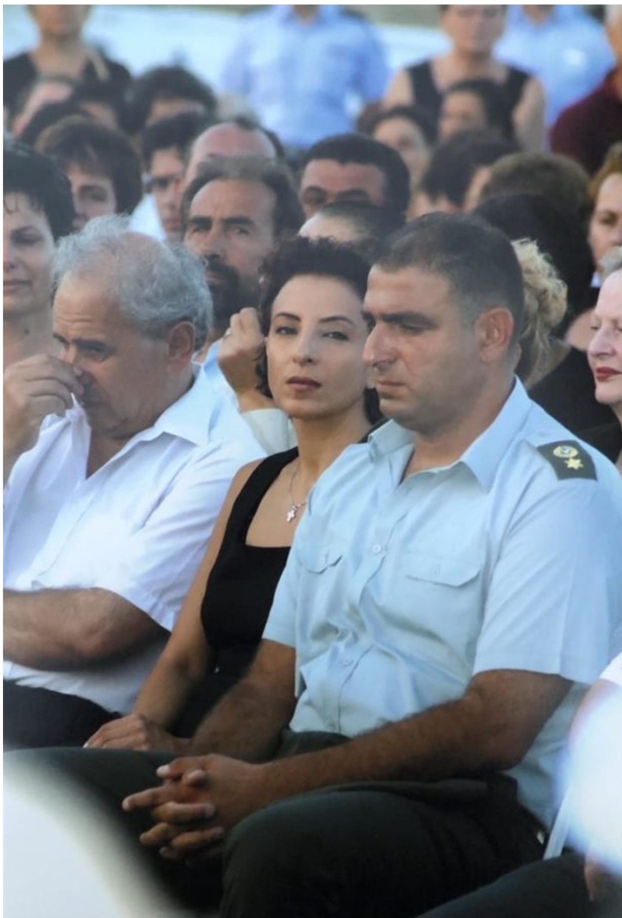
2005. Η Άντρη και ο Πάρις, από τα αποκαλυπτήρια του ανδριάντα του Τάσου