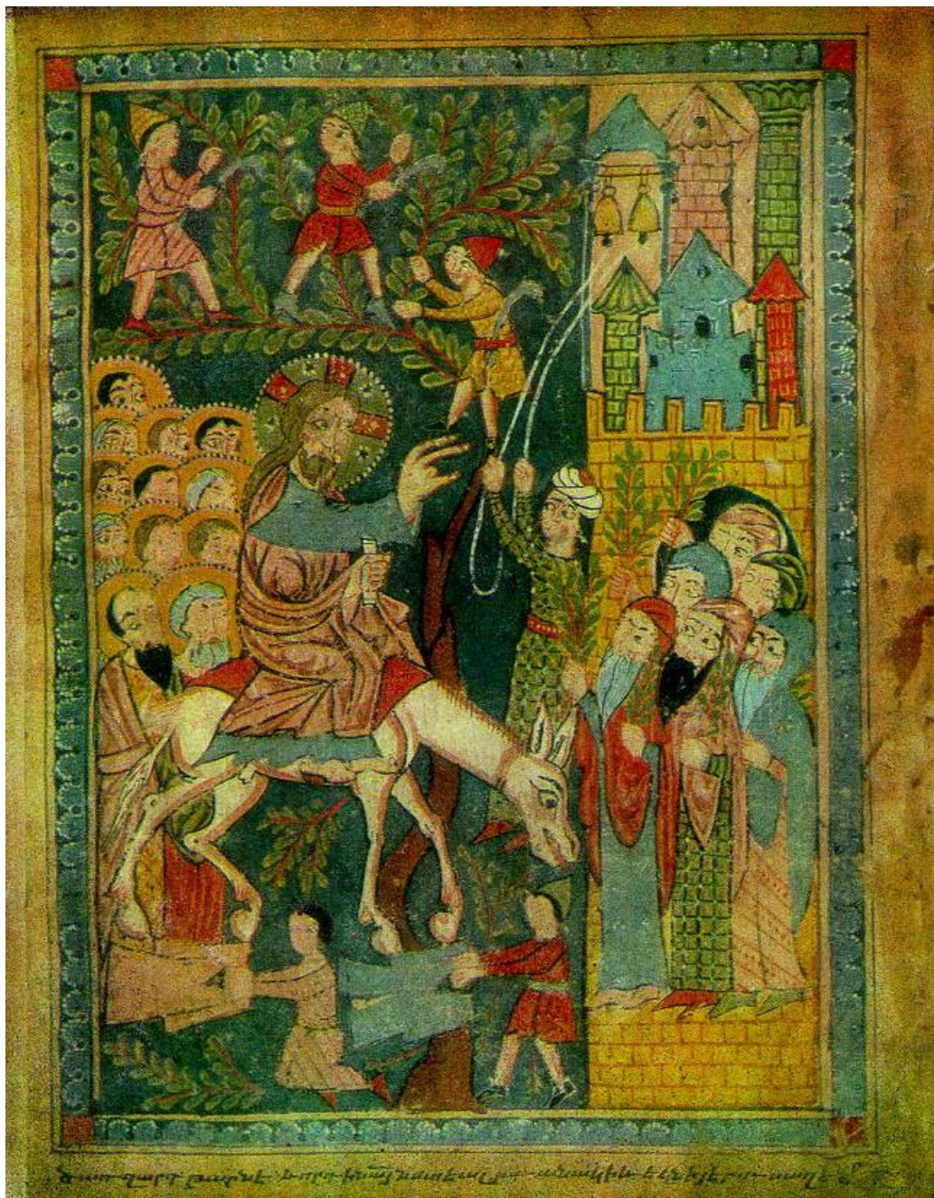
Η Βαΐοφόρος (Μικρογραφία από Αρμενικό χειρόγραφο του 14ου-16ου αι.)