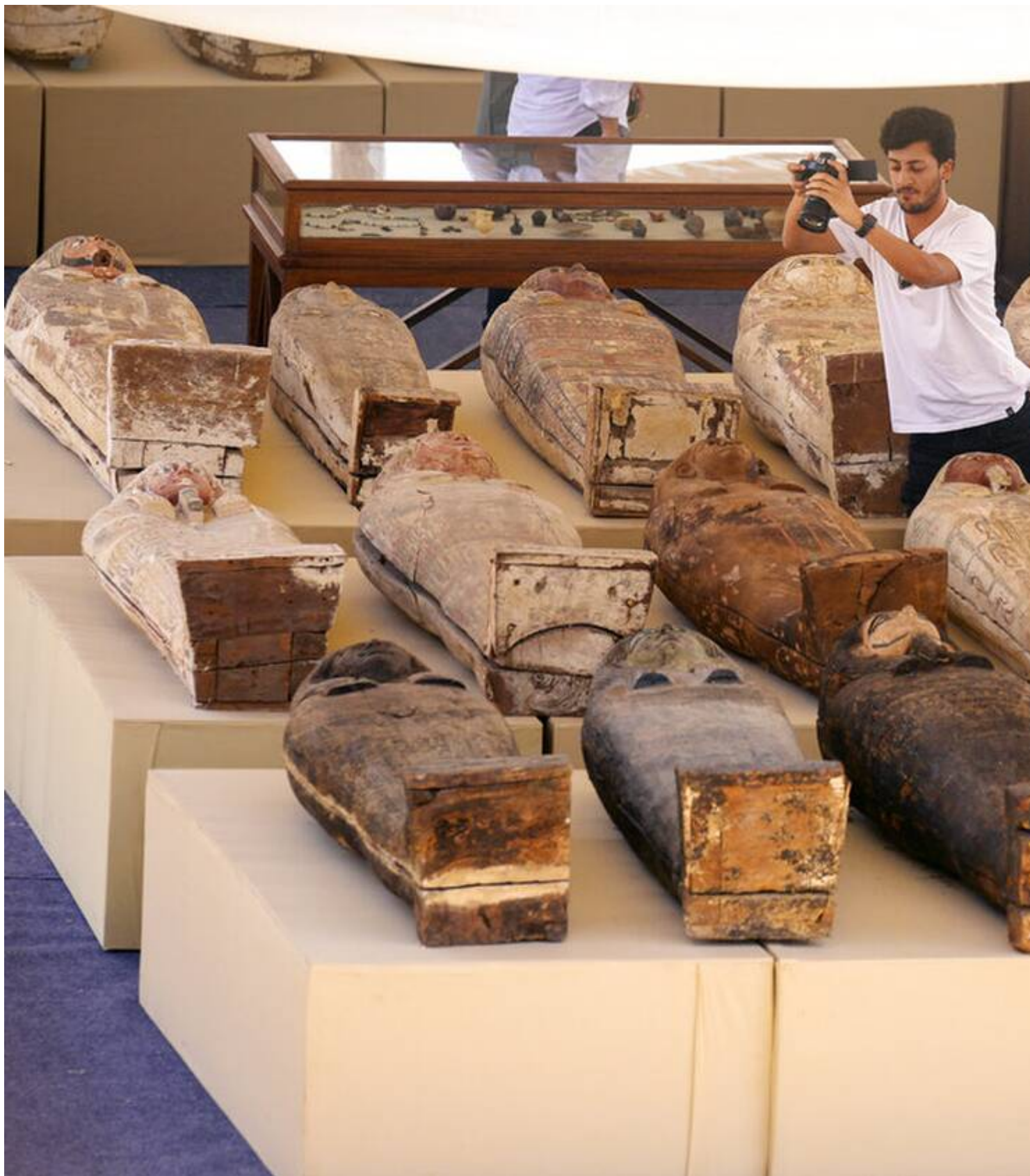
Τα αγάλματα που ανακαλύφθηκαν αναπαριστούν, μεταξύ άλλων, τους θεούς Άνουβις, Αμο ΑΡ

Οι 250 ξύλινες σαρκοφάγοι που εντοπίστηκαν χρονολογούνται από το 500 π.Χ. Σε μία από αυτές βρέθηκε ένας «ανέπαφος» και «σφραγισμένος» πάπυρος που