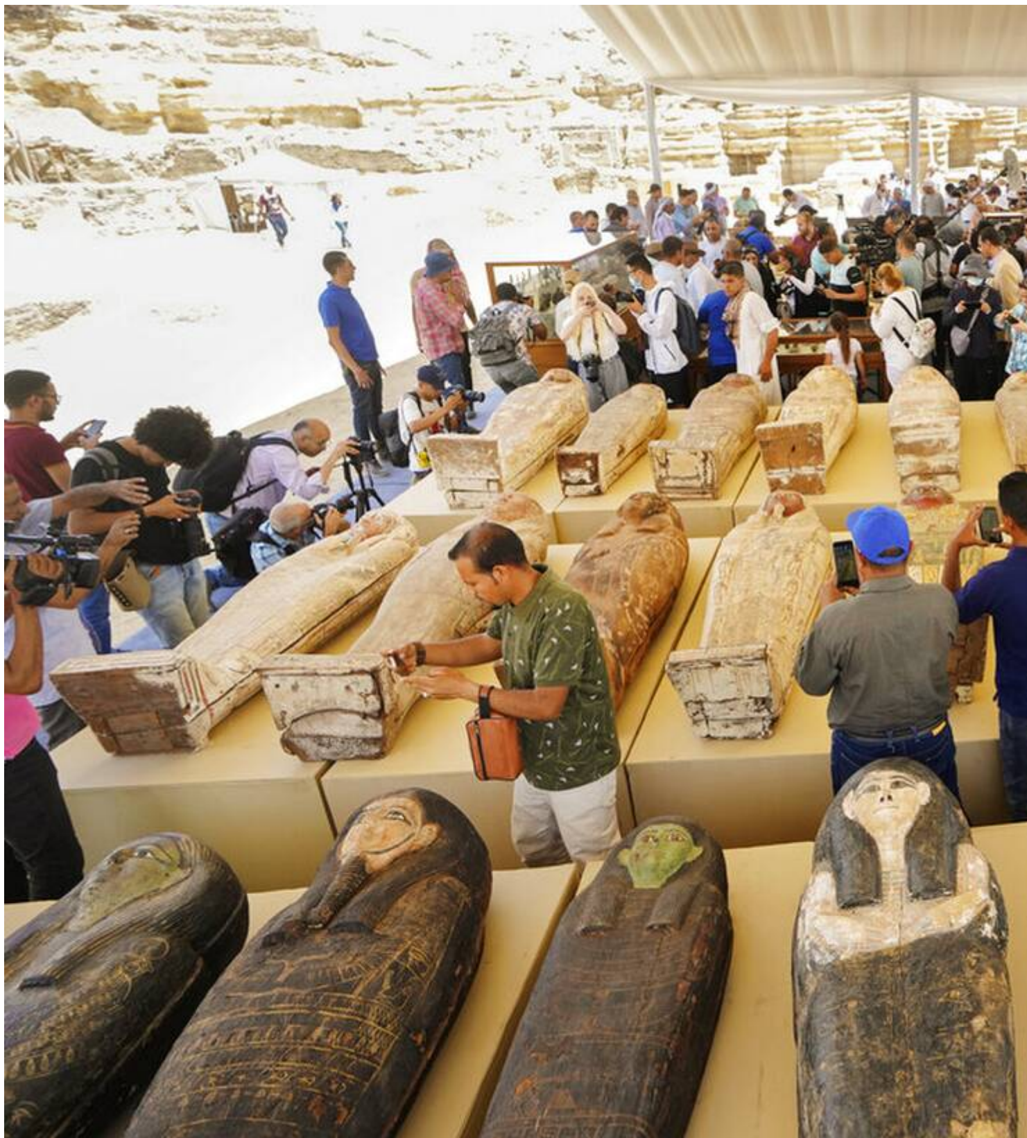
Η νεκρόπολη της Σακάρας, που απέχει περίπου 15 χιλιόμετρα από τη ΑΡ

Βρέθηκαν επίσης διάφορα καλλυντικά και κοσμήματα καθώς και δύο ξύλινα αγαλματίδια, με επιχρυσωμένα πρόσωπα, της Ίσιδας και της Νέφθης.