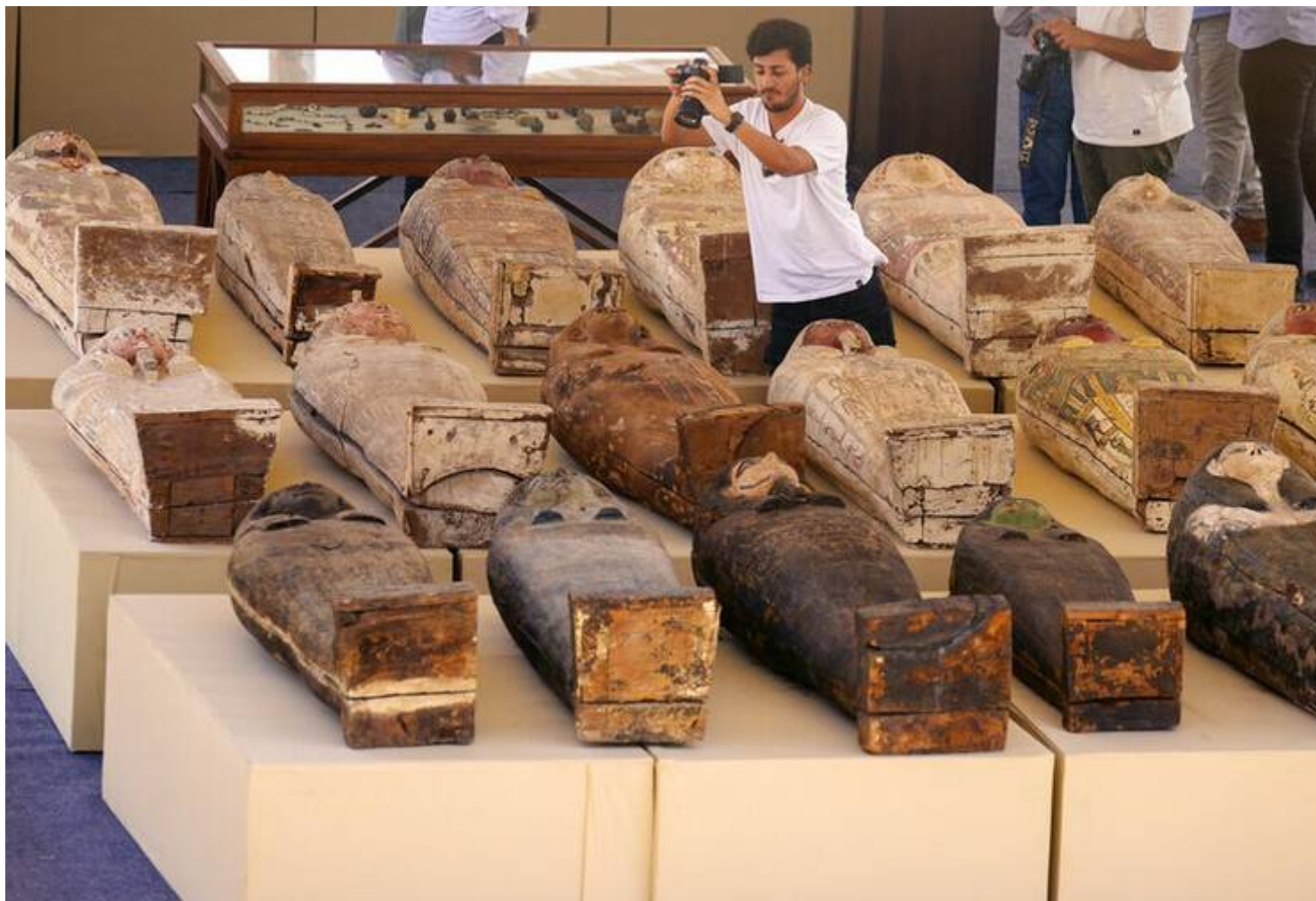
Οι 250 ξύλινες σαρκοφάγοι που εντοπίστηκαν χρονολογούνται από το 500 π.Χ. ΑΡ

Τα αγάλματα που ανακαλύφθηκαν αναπαριστούν, μεταξύ άλλων, τους θεούς Άνουβις, Αμούν, Μιν, Όσιρις, Ίσιδα, Νεφερτούμ, Μπαστέτ και Αθώρ, ενώ οι αρχαιολόγοι ανακάλυψαν και ένα ακέφαλο άγαλμα του θεοποιημένου αρχιτέκτονα Ιμχοτέπ, του κατασκευαστή της πυραμίδας της Σακάρας, όπως ανακοίνωσε το υπουργείο Τουρισμού και Αρχαιοτήτων.