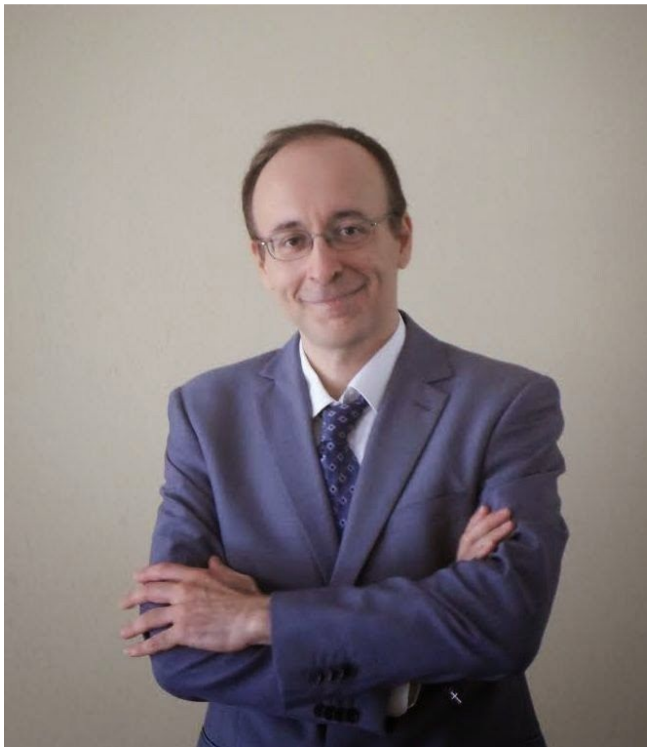
Ο συγγραφέας των best-sellers Θάνος Κουδύλης

«Η λεξιπενία είναι ένα φαινόμενο αυτή την εποχή στη χώρα μας που όλο και πιο συχνά έρχεται στην επιφάνεια. Ο νέο-Έλληνας όχι μόνο έχει ελλιπές λεξιλόγιο, αλλά αδιαφορεί ή και εσκεμμένα παραλείπει -διαγράφει - διαστρεβλώνει ακόμα και τα πιο απλά της ελληνικής γλώσσας, τα σημεία στίξης, όπως το ερωτηματικό (;). Συγκεκριμένα η χρήση του αγγλικού σημείου στίξης (?) αντί του ελληνικού (;) δηλώνει και κάτι περισσότερο, την ξενομανία μας στη χρήση ακόμα και της