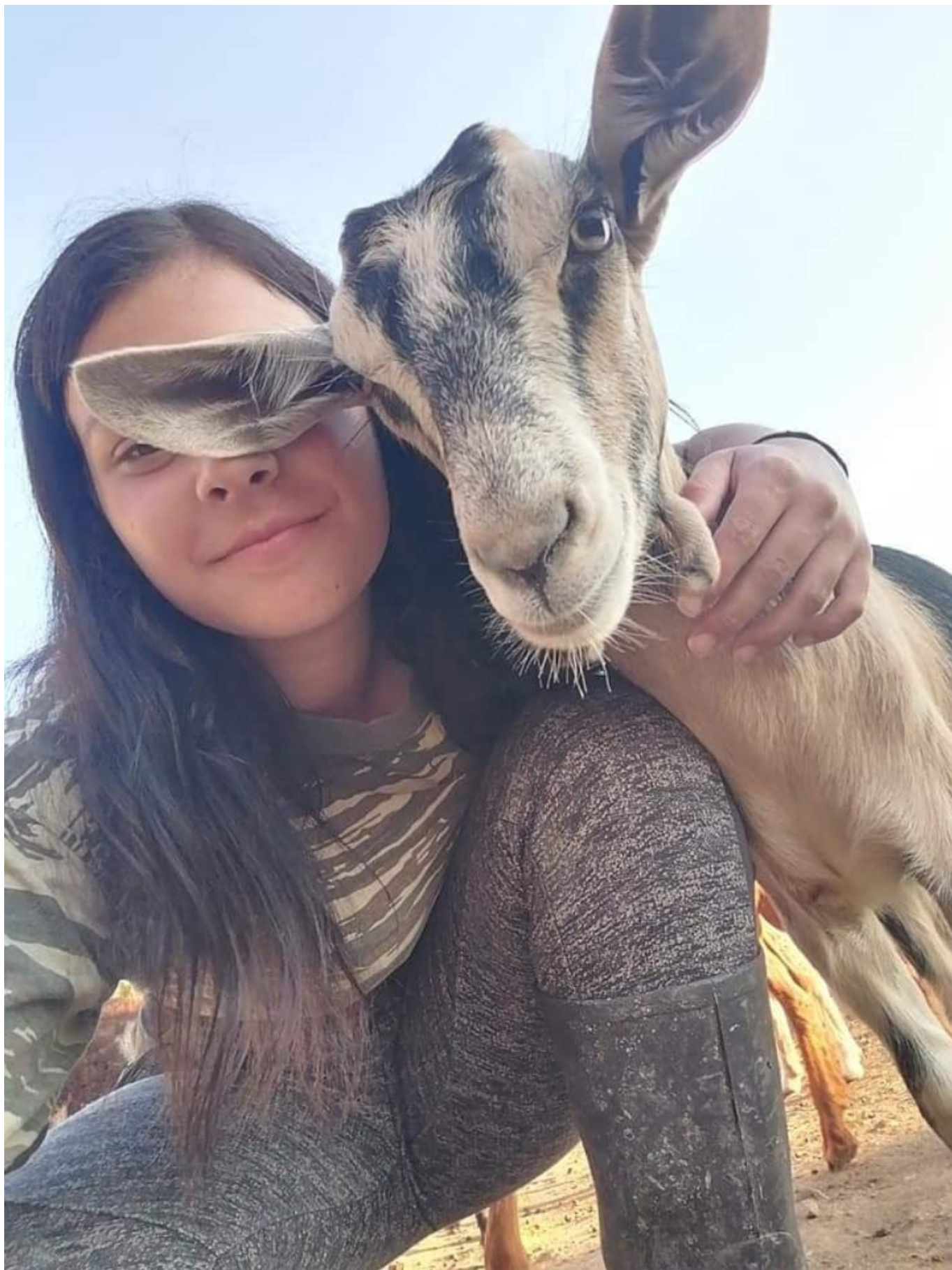
Η νεαρή βοσκός από τον Γαβαλά, αφιερώνει σχεδόν όλη της τη μέρα σε αυτό